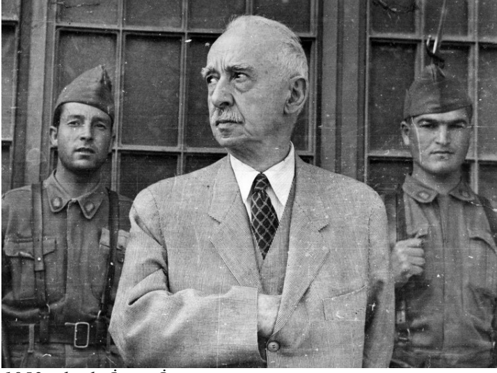
1952 yılında İsmet İnönü.

Bu süreçte, sinyali alan kamuoyunda bir liberal demokrasi furyası her yanı sarar. İnönü'nün Mayıs ayındaki nutkundan sonra Nuri Demirağ, Millî Kalkınma Partisi adlı bir muhalefet partisi kurar. Bu tam anlamıyla bağımsız bir partidir. Fakat İnönü, birkaç ay sonra, 1 Kasım 1945 tarihli TBMM açılış konuşmasında “Bizim eksliğimiz ikinci bir partidir”, yani “karşımızda muhalefet partisi yoktur” der. Yani İnönü, Millî Kalkınma Partisi'ni kaale almamaktadır. Onun istediği, CHP içerisinden çıkan, kontrollü, hatta bana uzun bir süre iktidara gelmeyi düşünmeyecek, mecliste varlık gösterecek yasal bir muhalefet partisidir. Bana kalırsa CHP'nin çok partili hayata geçerken arzuladığı da budur: Bir murakabe partisi.