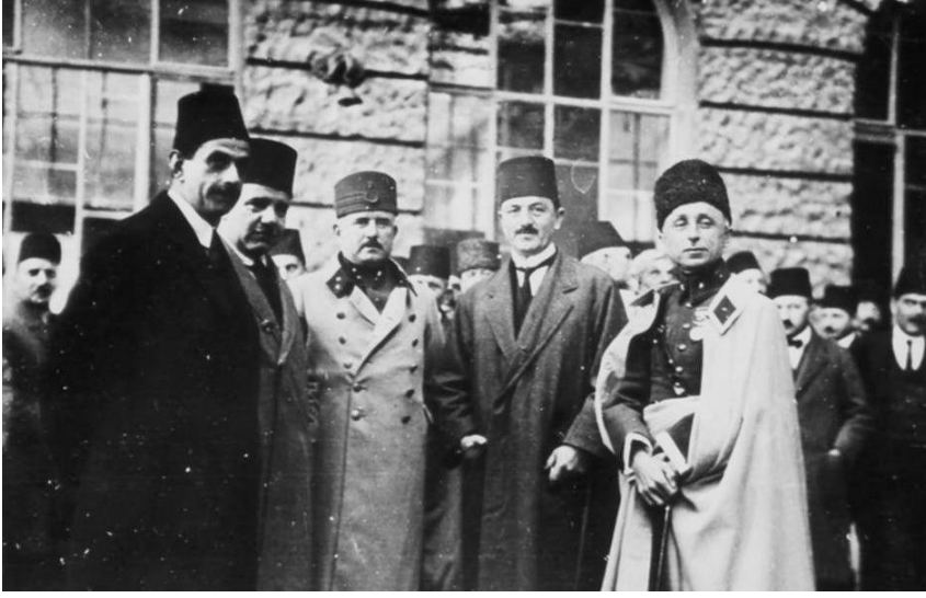
Türkiye Cumhuriyeti'nin ilk muhalefet partisi Terakkiperver Cumhuriyet Fırkası'nın kurucuları aynı karede. Soldan sağa: Adnan Adıvar, Ali Fuat Cebesoy, Kazım Karabekir, Rauf Orbay ve Refet Bele.