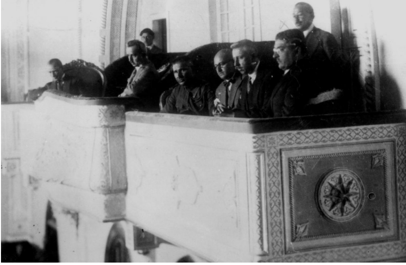
Reisicumhur Gazi, II. TBMM'de oturumları takip ediyor.

2- 1924 sonbaharına geldiğinde Millî Mücadele'nin mühim simalarından Kazım Karabekir, Ali Fuat Cebesoy, Refet Bele, Rauf Orbay gibi isimler muhalefet safında bir fırka teşkil ediyorlar fakat bu girişim Takrir-i Sükûn döneminin başlamasıyla beraber pek uzun ömürlü olmuyor. Terakkiperver Cumhuriyet Fırkası'nı doğuran sebepler neydi ve fırka neden kapatıldı hocam?