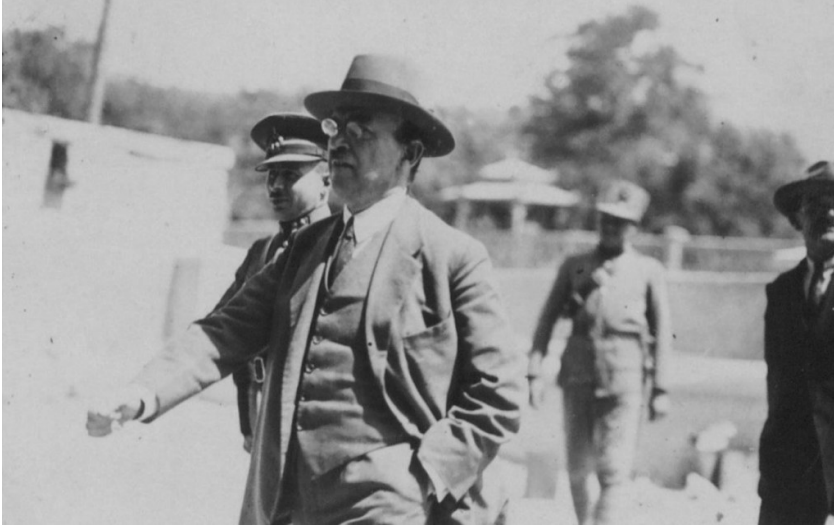
Cavit Bey, Cumhurbaşkanı Mustafa Kemal'e karşı suikast tertip etmek suçuyla yargılanacağı mahkemeye gidiyor.

Artık rejim oturmuştur. İçerideki kavga bitmiştir. "Paşalar", siyasi hayattan tasfiye olunmuştur. Bir yıl sonra 1927 yılında Gazi, CHF Büyük Kurultayı'nda okuyacağı Nutuk'ta tarihi adeta kendi ağzından yeniden yazacak ve bu tasfiyelere giden süreci bizzat anlatacaktır. O tarihten itibaren CHF mecliste tam manasıyla tek bir ses haline gelecek ve rejim kendisini pekiştirme yolunda ilerleyecektir. İzmir Suikasti hadisesi, bu bakımdan, Millî Mücadele'den beri süregelen bir iç mücadeleye nihayet vermiş ve Mustafa Kemal Paşa'nın otoritesi perçinlenmiştir.