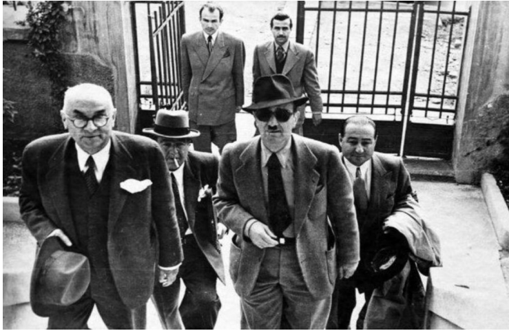
Demokrat Parti kurucuları aynı karede: Celal Bayar, Refik Koraltan, Fuad Köprülü, Adnan Menderes.