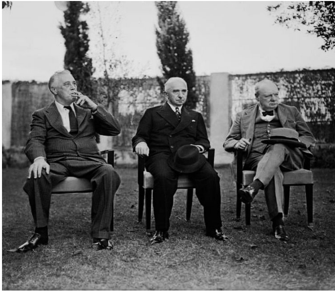
Franklin D. Roosevelt, İsmet İnönü ve Winston Churchill. Kahire, 1943.