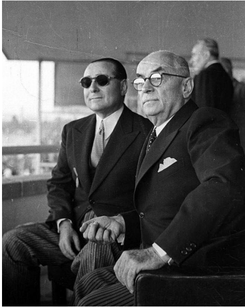
Başvekil Adnan Menderes ve Reiscumhur Celal Bayar.

Ne yazık ki İsmet İnönü'nün seçim vaadi olarak sunduğu anayasa değişikliği daha önceden yapılamamıştı ve mevcut anayasa, TBMM'yi üstün kıldığı için DP iktidarına ucsuz bir kuvvet bahşetmişti. Bu bakımdan, Türkiye'de tek parti rejiminin farklı bir iktidar partisi altında sürdüğünü söylemek yanlış olmayacaktır. TBMM'de elde edilen engin güç, DP'de ve Menderes'te bir bakıma güç zehirlenmesine de neden olacaktır. İnönü'ye, 1946 seçimlerindeki usulsüzlüklere ve daha pek çok konuya adeta takıntılı olan DP'liler, elde ettikleri güç ile başladıkları çizginin epey bir dışına çıkacaklar ve bir zamanlar kendilerinin eleştirdikleri pek çok uygulamayı bizzat kendileri hayata geçireceklerdir.