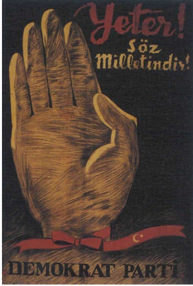
Demokrat Parti'nin bir propaganda afişi.

parlamentoya bahsettiği kudret daha öncesinde törpülenebilmiş olsaydı, DP bu denli baskıcı bir yola giremeyebilir ve bugün bildiğimiz son gerçekleşmeyebilirdi.