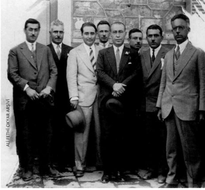
Serbest Cumhuriyet Fırkası'nın kurucusu Ali Fethi Bey, fırkanın Aydın teşkilatı başkanı Adnan Menderes ve diğer teşkilat üyeleri ile beraber.