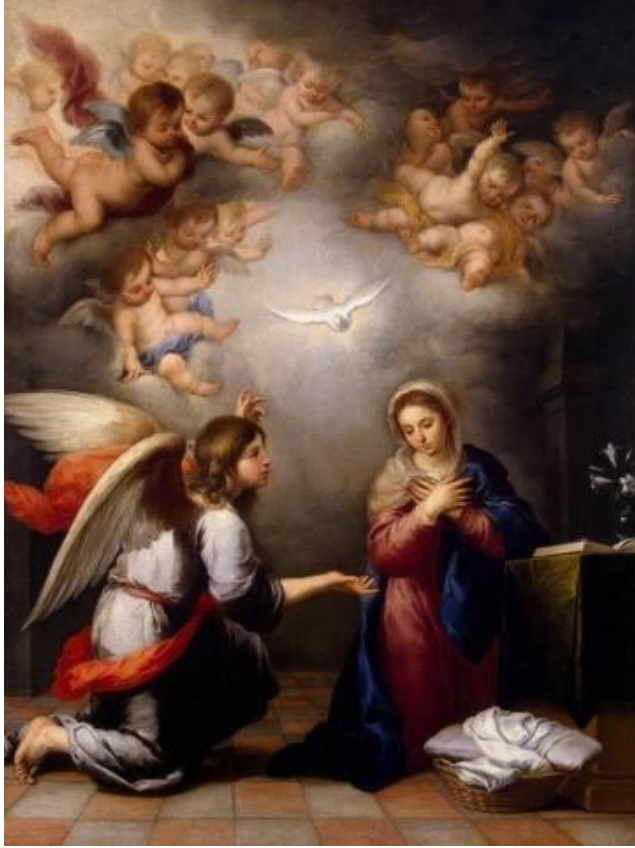
Hz. Meryem'e, Hz. İsa'ya Hamile Kalacağına Müjdelenmesi (Bartolomé Esteban Murillo) Nisan

Hocktide: Paskalya'dan sonraki pazardır. Orta Çağ'da insanlar ev ya da arsa için yılda dört kez kira öderlerdi. Vergilerin, kiraların, geçiş ücretlerinin ödenmesi, yılın ilk çeyreği için borçların toplanması zamanı idi. Adın anlamı borcun ya da borçlunun açığa çıkması ile ilgilidir. Geç Orta Çağ İngiltere'sinde Paskalya'dan sonraki ikinci pazartesi ve salı günü kutlanırdı. Geleneksel eğlence ilk gün kadınların erkekleri kovalayıp yakalayınca bağlaması ve para karşılığı serbest bırakması, ikinci gün aynı şeyi erkeklerin yapması ama öpücük karşılığı serbest bırakması idi. Kadınların aldığı paralar bölge kilisesinin hazinesine giderdi. Genellikle kasabalarda yapılır ve evli çiftler katılırdı. Kral 8. Henry tarafından yasaklanan bu adet, 1575'te I. Elizabeth tarafından yeniden uygulamaya konulmuştur.