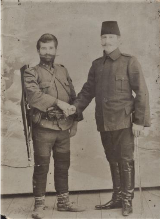
Atıf Bey, Resneli Niyâzi ile Birlikte

Bu ifadeler elbette abartılı sözlerdir lakin Atıf Bey’in nasıl bir işi başardığını ve ne denli bir coşkuya sebep olduğunu keskin bir şekilde gösterir. Ayrıca Cihan Harbi yıllarında Atıf Bey’in cemiyetin yönetim kademesine getirilmesi de ne kadar önemli bir kişi görüldüğünün kanıtıdır. İttihat ve Terakki Cemiyeti özellikle Makedonya sorununun çözülmesi için meclisin açılıp anayasanın yeniden yürürlüğe konulmasını istiyordu. Bu iki amaç da Atıf Bey’in attığı kurşun sayesinde gerçekleşmiş oldu.