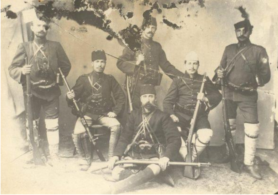
Atıf Bey, Fedai Şubesindeki Arkadaşlarıyla Birlikte

Atıf Bey'in Şemsi Paşa'ya düzenlediği suikast, fedai şubesinden bağımsız düşünülemez. Cemiyetin genel merkezi paşayı vurmak için gönüllü arıyor ama kolay kolay bulunamıyor. En sonunda Atıf Bey dört fedai arkadaşıyla birlikte gönüllü oluyor ve bu görevi Atıf Bey'e veriyorlar.