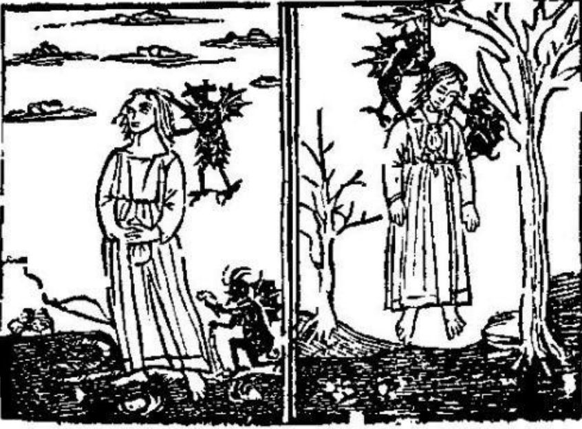
Kendini Asmak Suretiyle İntihar Eden Bir Kadının, İblislerden Etkilendiği Tasvir Edilmiş