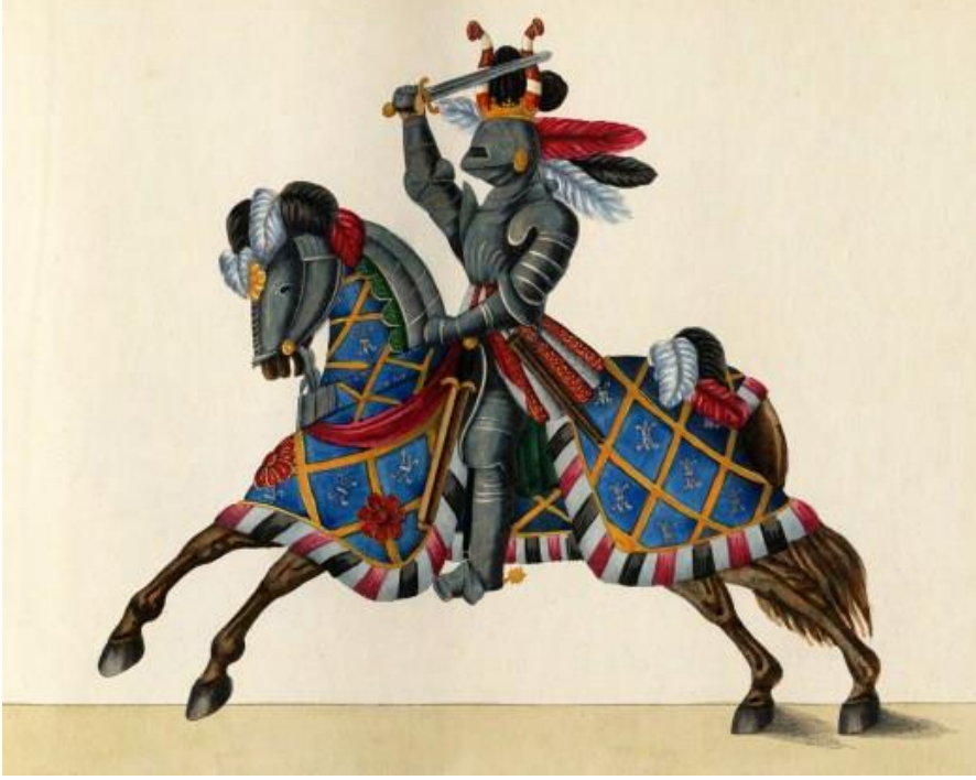
Zırhı ve Atıyla Bir Şövalye Tasviri