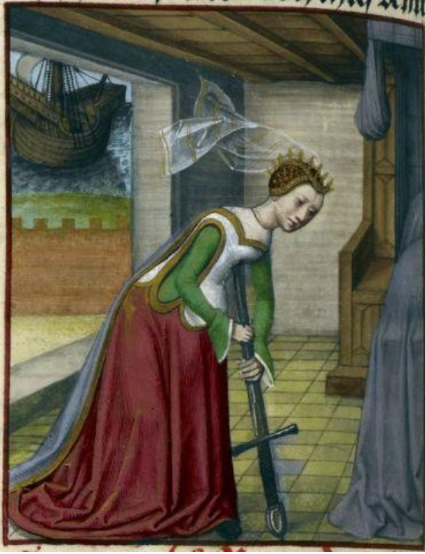
Kılıcının Üzerine Düşen Bir Kadın

Zenginler için bu saklama olayı daha önemliydi çünkü kişi intihar etmişse servet kraliyet hazinesine kalacak ama normal ölüm olmuşsa varislere geçecekti.