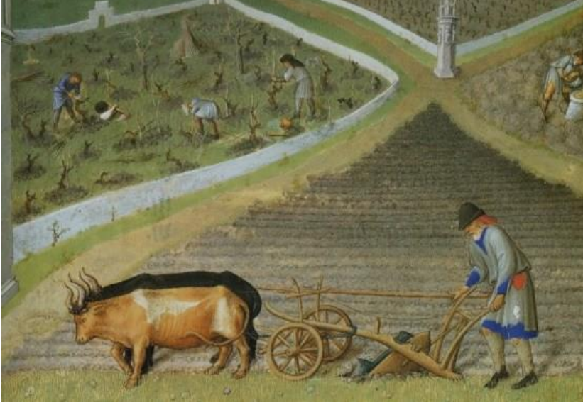
Orta Çağ Avrupası'nda Tarım