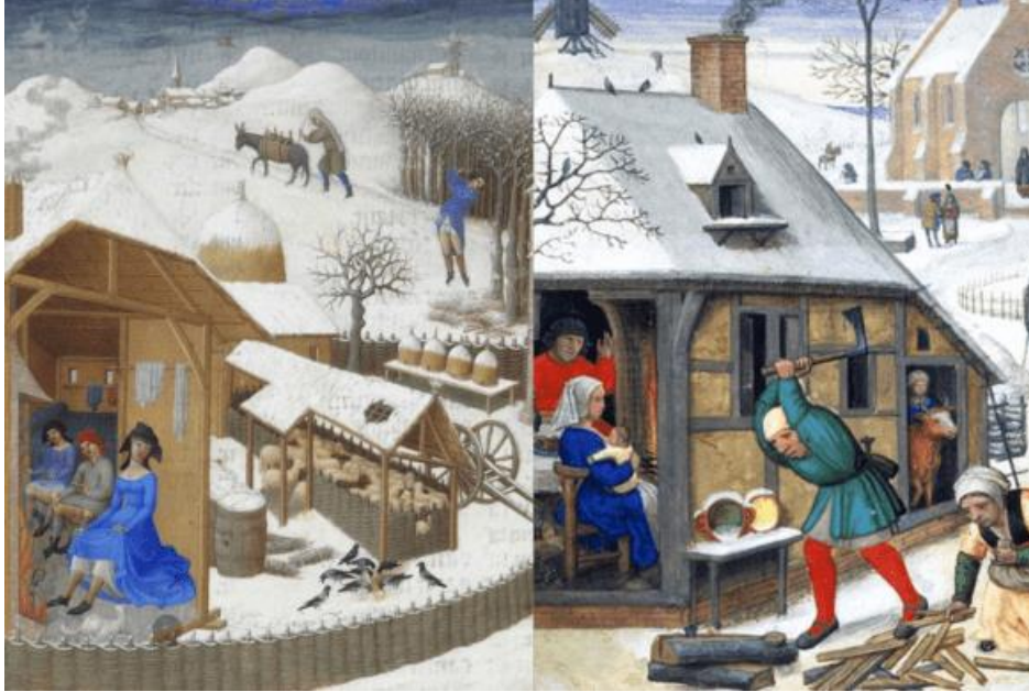
Orta Çağ Avrupası'nda Kış

Kül Çarşambası: Tarihi deđişken olan bugün Büyük Perhiz'in ilk günü idi. Tüm Hristiyanlar ayine katılır, rahip tarafından alınlarına kül ile haç işareti yapılırdı. Bugünü izleyen çarşamba, cuma ve cumartesi günlerinde iyi Hristiyanların katı bir kefareti yerine getirmeleri, birçok yiyecekten vazgeçmeleri ve zamanlarını dua ederek geçirmeleri beklenirdi.