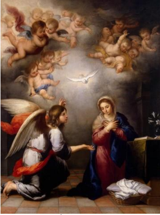
Hız. Meryem'e, Hız. İsa'ya Hamile Kalacağıının Müjdelenmesi (Bartolomé Esteban Murillo)

hazinesine giderdi. Genellikle kasabalarda yapılır ve evli çiftler katılırdı. Kral 8. Henry tarafından yasaklanan bu adet, 1575'te I. Elizabeth tarafından yeniden uygulamaya konulmuştur.