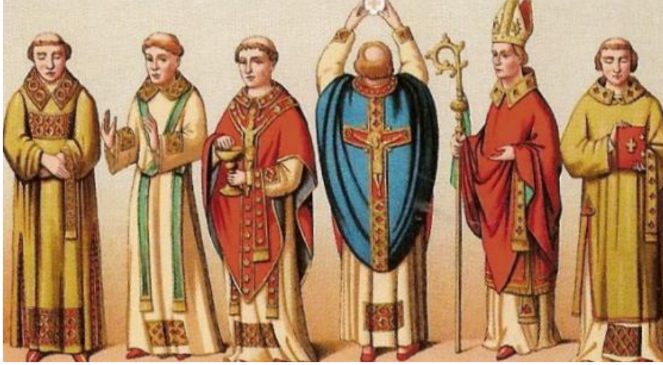
Orta Çağ Avrupası'nda Rahipler

Aslında kafa tıraşı rahibelik yemini eden kadınlar için de geçerliydi. Muhtemelen en ünlü örneği Assisili Azize Clare idi. Kadın saçını günahla ilişkilendirildiği için tıraş olmak ya da kısa saç rahibeler için uygundu ya da saçın tamamen örtülmesi gerekiyordu. Yine Pavlus'un Korintlilere 1. mektubunda (11:5-10) başı açık dua eden her kadının başını küçük düşürdüğü, kadın başını açarsa saçını kestirmesi gerektiği ama saçını kestirmesi ya da tıraş etmesi ayıpsa örtünmesi tavsiye edilmektedir. İlginç şekilde erkek gibi görünmek için takma sakal takan rahibeler de vardı.