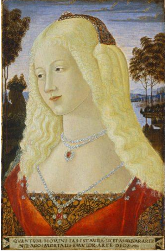
Bir Leydi Portresi (Neroccio di Bartolomeo de' Landi)

Sakal konusunda Karolenjler döneminde erkekler sakalsız ama bıyıklıydılar. Uzun sakal Orta Çağ Avrupası'nda Müslüman, Yahudi ve putperest kişiyi işaret ettiği için pek tercih edilmiyordu.