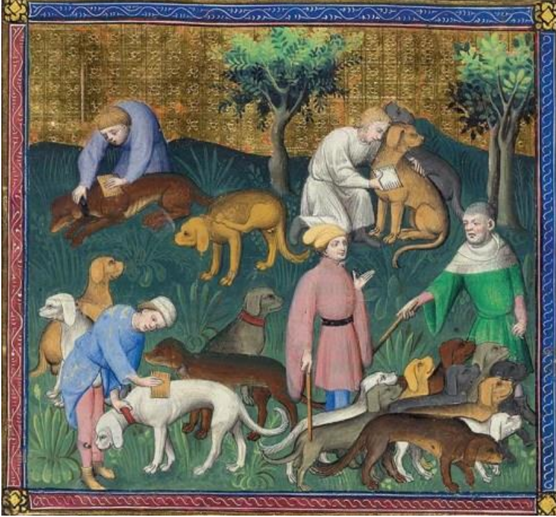
Livre de la chasse, c. 1406–1407

Kediler Orta Çağ Avrupası'nda çok sevilen hayvanlar değildi, sadakatsiz oldukları düşünülüyordu. Yabancı kedilerin yaygın olduğunu bir piskopos emrinden anlıyoruz. Şöyle ki; 1127'de piskopos Corbyl, başrahibeler ve rahibelerin sadece yabancı kedi ya da kuzu kürkü giyebileceklerini, daha değerli bir şey giyemeyeceklerini bildirmiştir. Demek ki yabancı kediler kolay bulunuyordu ve yaygındı, çok değerli değillerdi. Bu hayvanlar boyunlarından kesilerek öldürülüyor ve derileri soyulduktan sonra gömülüyorlardı. 1363 tarihli bir İngiliz yasası da halkın kedi, koyun, tilki ve tavşan kürkünden başkasını giymesini yasaklamıştır. Bu dönemde kedi etinin yendiğini söyleyenler de vardır. Kedilerin fiyat olarak değeri de çok düşüktü. Avrupa'daki kediler genelde gri iken, Suriye'den İtalya yoluyla Avrupa'ya getirilenler kahverengi ya da siyahtı.