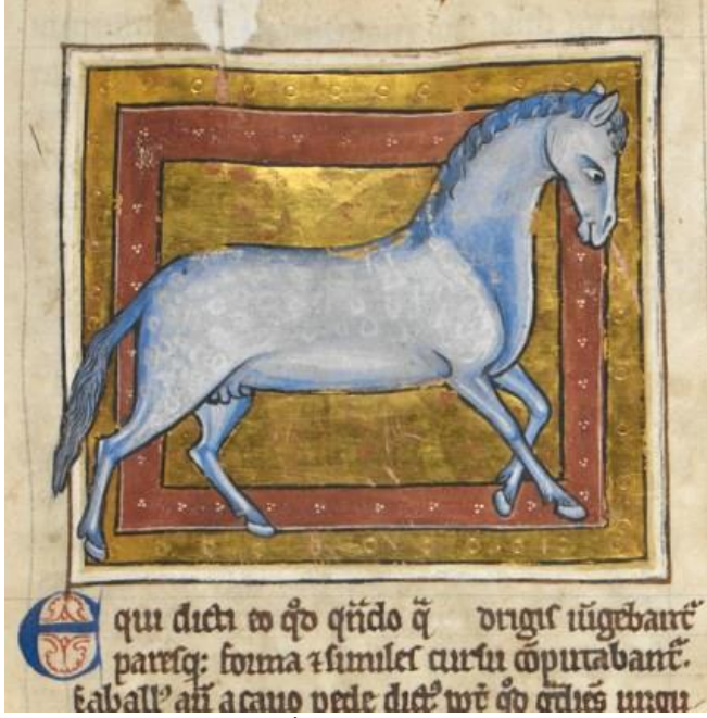
Bir Elyazmasında At (İngiltere, 13. Yüzyıl)