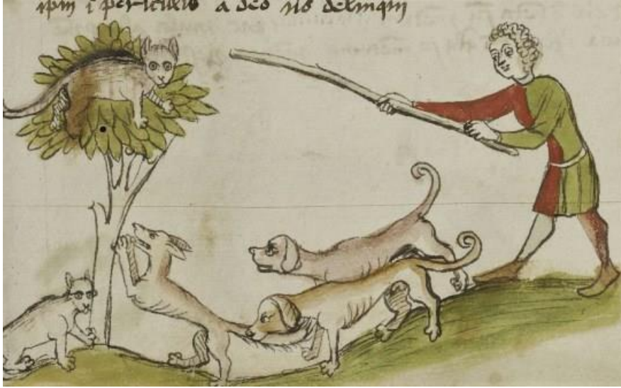
Bir Adamın Köpekleriyle Birlikte Ağaçtaki Kediye Taciz Etmesi (15. Yüzyıl Sonları, Almanya)

zihnine daha çok yerleşmiş olmalı. Gerçi herkes kedilerden nefret etmiyordu, rahibelerin bile kedi beslediğini biliyoruz. Doğu dünyasındakinin aksine Batı’da köpek daha çok tercih ediliyordu. Bu arada kedilerin sayısının azalmasının vebanın artışıyla bir ilgisi olmadığını da söylemeliyim.