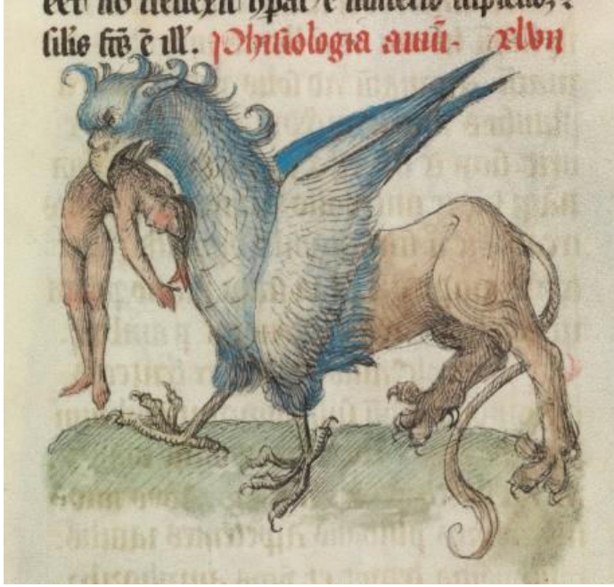
Mitolojik Bir Varlık Olan Griffin

Milanlı Ambrosius da hayvanlar hakkında yazmıştı, ona göre Tanrı vahşi hayvanları, insanoğlu evcil hayvanları kontrol ediyordu. Sevilalı Isidore 7. yüzyılda yazdığı eserinde tüm hayvanların isimlerinin kökenlerini açıkladı, hayvanları vahşi ve evcil olarak ikiye ayırdı. 13. yüzyılda yazan Aquinolu Thomas'a göre hayvanların yaratılmasının asıl amacı yiyecek olmalarıydı. Hayatları kendileri için değil insanoğlu için korunuyordu. Dolayısıyla hayvan öldürmek suç değildi ama başkasının hayvanı öldürülemezdi.