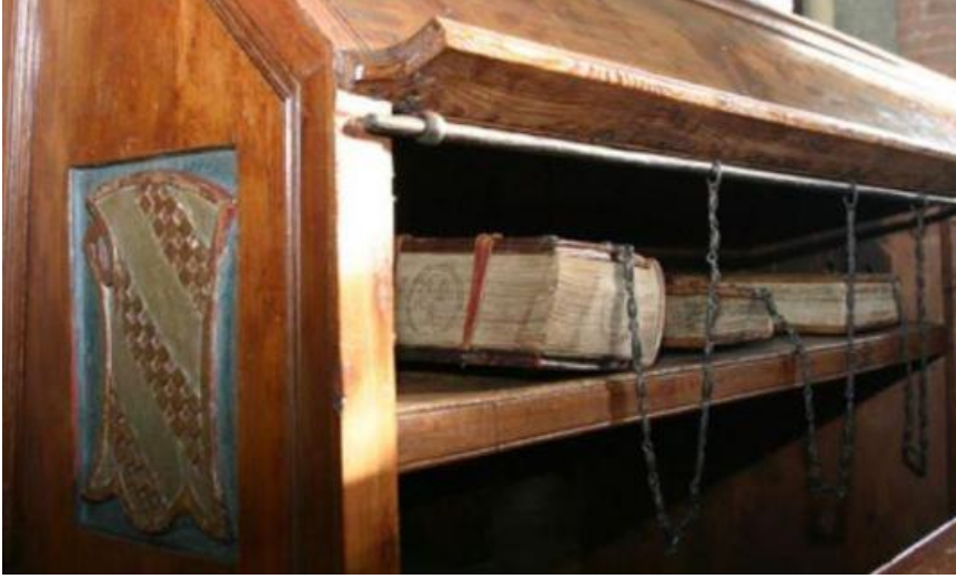
Kürsü ve Altındaki Zincirli Kitaplar Cesena, Istituzione Biblioteca Malatestiana www.comune.cesena.fc.it