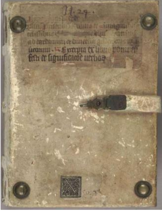
Austin, Harry Ransom Humanities Research Center, MS HRC 29. 10-11. Yüzyıl

Başka bir yöntem kapaktaki başlık kısmının ince bir boynuz ya da kemik parçası ile çerçevesi ve bir pencere oluşturmaktır. Bu kemikler kapağa çivilerle tutturulmuştur.