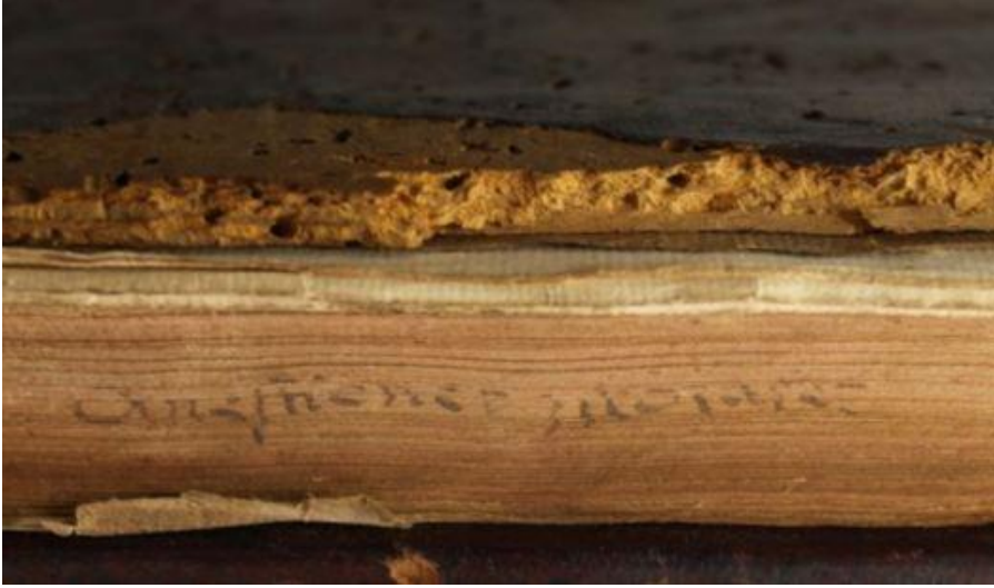
Quaestiones Morales. Pars 1. Ölçüleri: 284x197x43 Washington, Folger Shakespeare Library, INC_M26, 1487, İngiltere

Tarihsel sıralamaya baktığımızda kitap bilgilerinin önce üst ve alt kenarlara, sonra yan kenara ve sonra da sırt bölgesine yazıldığı görülüyor. Bunun nedeni kitapların Erken ve Yüksek Orta Çağ'da yatay, Geç Orta Çağ'da ön kenarı okuyucuya bakar şekilde dik ve Erken modern dönemde sırt kısmı dışa dönük dik şekilde saklanmasıdır. Kitabın künyesi çoğunlukla kapağa ya da kenarlara yazılmıyor, kitabın içinde ne olduğunu merak edenler sayfaları incelemek zorunda kalıyorlardı.