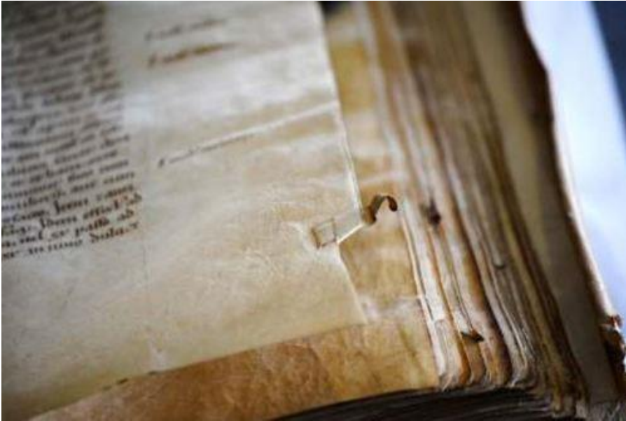
Leiden, Universiteitsbibliotheek, BPL MS 2001, 12. Yüzyıl

Evet, okuyucular kitaplara ayraç da koyuyorlardı. Örneğin iğneler ayraç olarak kullanılabilirdi ya da sayfanın kenarına önemli olduğu göstermek için dikilen bir ip ya da sayfa arasına konan bir yaprak, dal, saman parçası ayraç görevi görebiliyordu. Yer imleci olarak kullanılan yöntemler arasında sayfanın kenarından kesilerek bir parça çıkarılması, bir kesi atıp bu parçanın bu kesiden geçirilmesi ve bir kısmının da kitabın dışında bırakılması gösterilebilir.