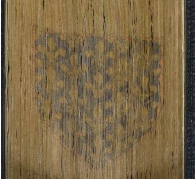
London, British Library, Burney MS 275. 1309-1316 Arasında, Paris'te, Gotik yazı stilinde

Orta Çağ'da kitapların kenarları genellikle süslenmezdi ya da yapılırsa da mütevaziydi. İstisnalar elbette vardı.