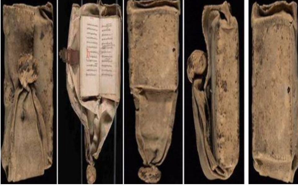
Yale Beinecke Library, MS 84, yak. 15. Yüzyıl