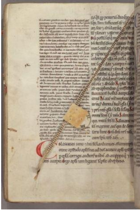
Harvard, Houghton Library, MS 277, 12. Yüzyıl

Sayfanın hangi sütununda kalındıysa yuvarlak parça o tarafa çevriliyor, hangi satırda kalındıysa işaretleyici o satıra kadar aşağı çekiliyordu. Sayıların dörde kadar olmasının sebebi Orta Çağ elyazmalarında genelde en fazla dört sütunun olmasıydı. İki'den fazla sütunu olan sayfalarda yuvarlak parça üzerindeki sayılar sütunu işaret ediyordu. Böylece bu ayraçla hem sayfa, hem sütun hem de satır belirlenmiş oluyordu.