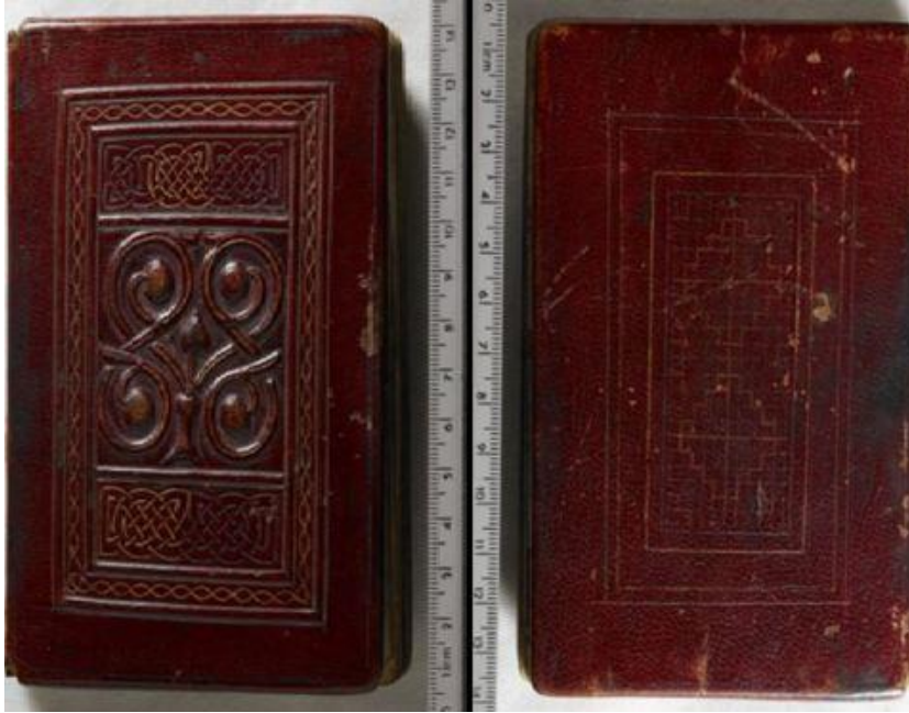
Ön ve Arka Kapak

Kitap kapakları ve ciltleri çoğunlukla dana ve domuz derisinden yapılıyordu. Kitap kaplanan diğer malzeme kumaştı ama dayanıksız olduğu için az kullanılıyordu. Deri kullanılmasının amacı sert olduğu için kitabı korumasıydı. Su geçirmiyordu. Bu önemliydi çünkü manastırlarda kitapların tutulduğu koridorlar açık havada olabiliyor, dolayısıyla nemlenebiliyor, ıslanabiliyordu. Ayrıca deri üzerine şekil ve desenler yapılabilirdi. Bu anlamda günümüze gelen en eski kitap 7. yüzyılda İngiltere'nin kuzeydoğusunda yazılan St. Cuthbert İncili'dir. Ketan iplikle dikilmiştir ve Erken Orta Çağ deri kaplamalarının ne kadar güzel olduğunu gösterir. Bu elyazması azizin 687'deki ölümünden kısa süre sonra tabutuna yerleştirilmiş ve Durham Katedrali'ndeki mezarı 1104'te yeni tapınağına yerleştirilmek için açılınca keşfedilmiştir.