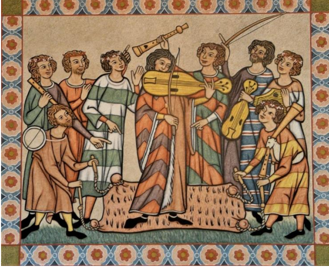
Orta Çağ'da Müzik

Mümkünse materyal kullanmak da önemli. Elbette o günün şartlarını yaratmamız, ürünlerini kullanmamız mümkün değil ancak öğrencilere az da olsa o ruhu aşılabilirsek dönemi de konuyu da çok daha iyi özümseyebiliriz. Örneğin öğrencilerimle balmumu tabletler hazırlamayı ya da yapay kuştüyü kalemlerle yazı yazmayı deniyoruz. Roma Tarihi dersinde tariflerine sadık kalarak hazırladığım yemekleri tadıyoruz, bir erkek öğrencime özel olarak diktirdiğim toga giydiriyorum ya da orijinal boyutlarına göre hazırladığım gladius ve scutum ellerinde tutabiliyorlar. Roma döneminde özellikle kadınların oyun oynamak için kullandıkları aşık kemiklerinin gerçeklerine temas ederek oyunun nasıl oynandığını deneyimleyebiliyorlar. Böylece o dönem insanların hislerini bir nebze de anlayabileceklerini umuyorum.