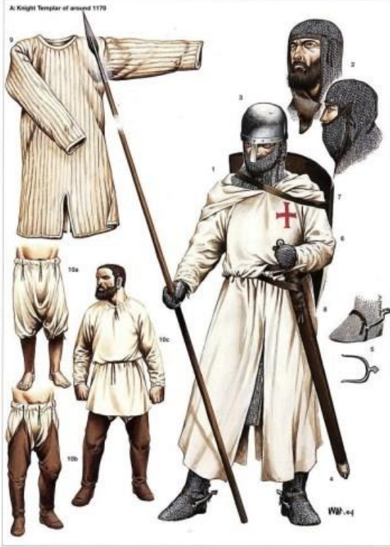
Tapınak Şövalyeleri'nin Tüzüğe Göre Belirlenmiş Kıyafetleri, 1170'ler