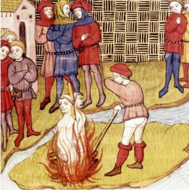
Kazığa Bağlanarak Yakılan Örgüt Üyeleri

Tapınakçılar, İkinci Haçlı Seferi'nden itibaren bu açıdan Haçlı orduları içinde ön plana çıkmaya başladılar. Buna somut bir örnek vermek gerekirse, İkinci Haçlı Seferi'nde, Fransa Kralı VII. Louis'in komutasındaki Fransız ordusunun 6 Ocak 1148'de Pisidia yakınındaki boğazdan geçerken uğradığı ani saldırı ve bu saldırının püskürtülmesinde Tapınakçıların etkin rolü gösterilebilir. Bu tür olaylar, Tapınakçıların diğer Haçlı askerleri arasındaki itibarını yükseltip morali yaratmıştı. Ama aynı zamanda birbirlerine rakip askerlerden ve soylulardan mürekkep böyle bir ordunun disiplinden uzak dağınık yapısı da, Tapınakçıların sıkı disiplin anlayışlarıyla hiçbir türlü bağdaşmıyordu. Bu gerçeği kısa sürede fark eden kral, Tapınak Şövalyeleri'ni ordunun komuta kademelerine atayarak, birlikleri de onların emrine verdi. Bir başka deyişle, Haçlı ordusu artık Tapınak Şövalyeleri'nin komutası altına girmişti. Bu örnek üzerinden Tapınakçıların, Haçlı orduları içerisinde katı disiplin anlayışına dayalı düzenli bir ordu niteliği taşıyarak, Müslümanlara karşı yürütülen mücadelelerde nasıl etkin bir rol üstlendiklerini anlayabiliriz. Kısacası Tapınakçılar, Haçlı Seferleri boyunca Haçlı ordularının düzenli ve profesyonel asker/ordu ihtiyacını karşılayan örgütlerden birisi olmuştur desek, muhtemelen abartılı bir cümle kurmuş olmayacağız.