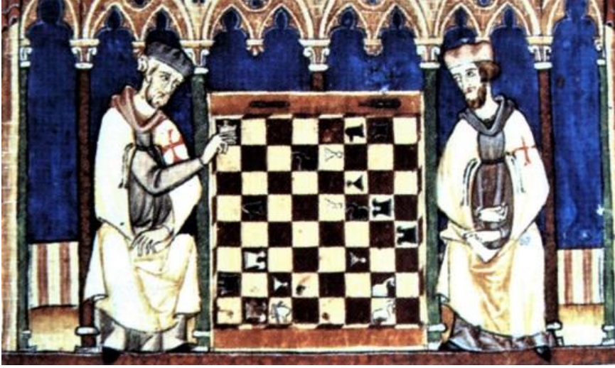
Satranç Oynayan Tapınak Şövalyeleri

Türkopoller, Türkopol Komutanı adlı bir liderin emri altında organize olurlardı. Türkopol Komutanı emri altındaki Türkopol askerlerini organize etmenin yanı sıra örgütün savaşta sancak olarak taşıdığı “Bauceant” adlı bayrağı taşırdı ve Tapınakçıların katılacağı savaşlar için keşif görevi üstlenirlerdi ve örgütün hazırlıklarını ona göre yapmasını sağlardı. Türkopol Komutanı, Büyük Üstad ve Mareşal’in emri olmaksızın da asla taarruz emri veremezdi.