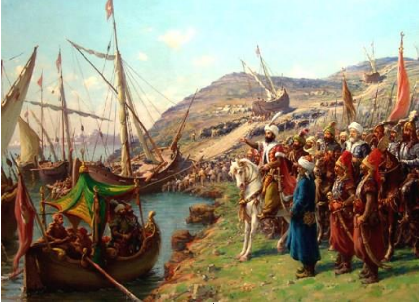
Fausto Zonaro'nun Gemilerin Haliç'e İndirilmesini Tasvir Ettiği Tablosu

anlatan eserden istihraç ederek, yeniden manzum şekilde kaleme almıştı. II. Mehmed'in bu eserin orijinal nüshasını görüp okumuş olması pekala mümkündür. Bu hadise, Haliç'e giren ve Bizans'a yardım getiren gemilerin ortaya koyduğu manevi çöküntüyü gideren ve yeniden kuşatmacılara şevk veren bir özelliğe sahiptir. Tabii ki müdafiler için büyük bir hayal kırıklığına yol açmış, dayanma güçlerini zayıflatmıştır.