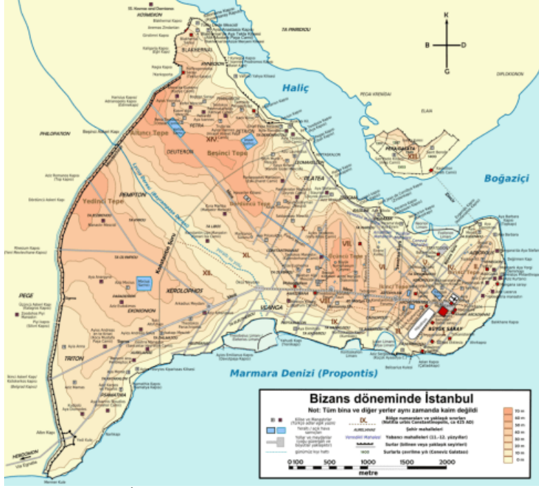
Bizans Dönemi İstanbul'u, Surları ve Kapılarıyla Gösteren Harita

teknolojilerin kullanıldığı ateşli silahlara dayalı sistemlerin devreye sokulduğu, büyük toprakların yapıldığı, İstanbul'un muhasarası için ne gibi planlara başvurulacağını hesaplarının daha bu dönemde gerçekleştirildiği anlaşılmaktadır. Tabii ki batıda siyasi durumun iyi şekilde etüd edildiği biliniyor. Bu diplomatik teşebbüslerde Çandarlı'dan çok istifade edildi.