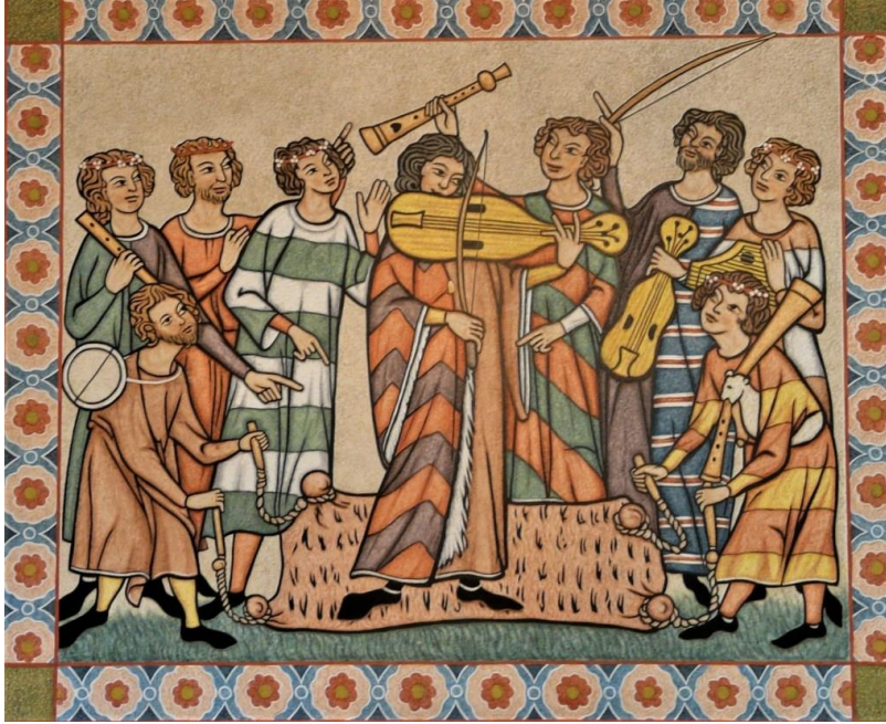
Orta Çağ'da Müzik

Mümkünse materyal kullanmak da önemli. Elbette o günün şartlarını yaratmamız, ürünlerini kullanmamız mümkün değil ancak öğrencilere az da olsa o ruhu aşılabilirsek dönemi de konuyu da çok daha iyi özömsüyorlar. Örneğin öğrencilerimle balmumu tabletler hazırlamayı ya da yapay kuştüyü kalemlerle yazı yazmayı deniyoruz. Roma Tarihi dersinde tariflerine sadık kalarak hazırladığım yemekleri tadıyoruz, bir erkek öğrencime özel olarak diktirdiğim toga giydiriyorum ya da orijinal boyutlarına göre hazırladığım gladius ve scutum ellerinde tutabiliyorlar. Roma döneminde özellikle kadınların oyun oynamak için kullandıkları aşık kemiklerinin gerçeklerine temas ederek oyunun nasıl oynandığını deneyimleyebiliyorlar. Böylece o dönem insanların hislerini bir nebze de anlayabileceklerini umuyorum.