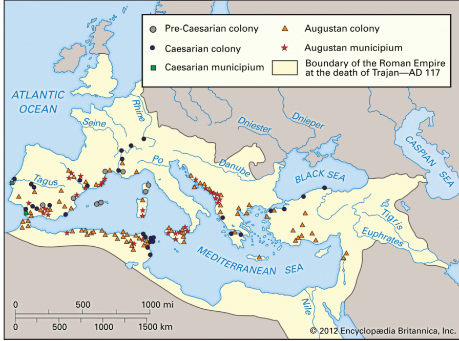
MS 117'de Roma İmparatorluğu

sentezinden oluşan yeni bir medeniyet bina ettiler. O medeniyet bugünkü Avrupa'nın temellerini oluşturmaktadır.