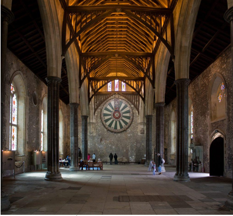
Winchester Kalesi, İngiltere

Büyük salon başlangıçta kısa süreli konukların gece konakladığı, hatta bazen üst mevkideki hizmetçilerin kaldığı bir yerdi. 15. yüzyılda ise konut işlevi yerine mahkeme işlevini üstlenmeye başladı. Hizmetkârlar salonu hızlıca temizleyip mahkeme haline getiriyorlardı. Duvarlardan birinin dibinde, yerden birkaç basamak yüksekte kale sahibinin oturması için ayrılmış bir yer vardı. Lord yemeklerini burada (dais) yiyordu. Bazen değerli av köpeklerinin de bu salona girmesine izin veriliyordu.