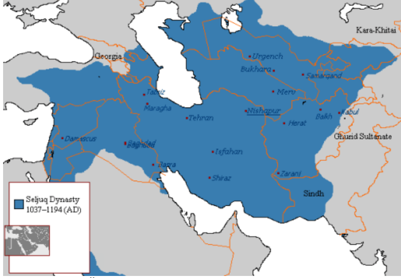
Melikşah'ın Ölümünde Büyük Selçuklu Sınırları