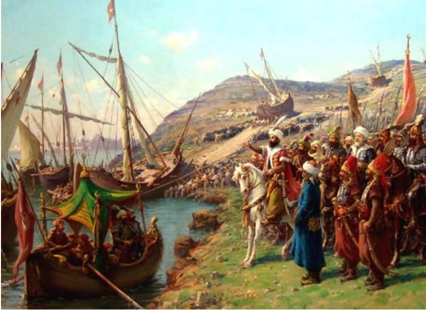
Fausto Zonaro'nun Gemilerin Haliç'e İndirilmesini Tasvir Ettiği Tablosu

Benim şahsi kanaatim İstanbul'un etrafını ve fiziki durumunu II. Mehmed'in çok iyi araştırdığı ve zayıf noktalarını etüt ettiği yönündedir. Bu anlamda Rumeli hisarının yapılması bir milat olmuştur. İstanbul'un deniz tarafından da kuşatma altına alınması bütün can damarlarının kesilmesi demektir. Bunu bildiği için II. Mehmed daha önceki örneklerden de hareket ederek gemilerin Haliç'e indirilmesi işini önceden planlamış olmalıdır. Limana yani Haliç'e girişi kapatan zinciri zorlayan Osmanlı donanması karşısında Bizans ve İtalyan gemilerini bulmuştur. Bu bakımdan stratejik bir deha eseri olarak gemilerin Haliç'e sokulması büyük bir iş olacaktır. Bu yolda vaktiyle Aydın beyi Gazi Umur Bey'in gemilerini karadan geçirdiği bilgisi II. Mehmed tarafından büyük ihtimalle biliniyordu. Çünkü Enveri adlı bir tarihçi Umur Bey'in gazalarını onun döneminde bu menakıbı anlatan eserden istihraç ederek, yeniden manzum şekilde kaleme almıştı. II. Mehmed'in bu eserin orijinal nüshasını görüp okumuş olması pekala mümkündür. Bu hadise, Haliç'e giren ve Bizans'a yardım getiren gemilerin ortaya koyduğu manevi çöküntüyü gideren ve yeniden kuşatmacılara şevk veren bir özelliğe sahiptir. Tabii ki müdafiler için büyük bir hayal kırıklığına yol açmış, dayanma güçlerini zayıflatmıştır.