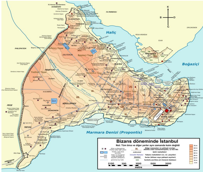
Bizans Dönemi İstanbul'u, Surları ve Kapılarıyla Gösteren Harita

almaktadır. Bazı kesimlerin uğursuzlukların kapısını açacağı gibi kötü bir algıyla beslenen zihinlerini aydınlatmak bakımından bu toplantıların müessir olduğunu düşünmek mümkün. Uç beylerinin de iknası yine bu toplantılarda oldu, çünkü onlar İstanbul'un denize bağlı bir merkez olma fikrinden endişelenip, gaza ve akınların zayıflayacağını düşünüyordu. Keza kuşatma için son teknolojilerin kullanıldığı ateşli silahlara dayalı sistemlerin devreye sokulduğu, büyük topların yapıldığı, İstanbul'un muhasarası için ne gibi planlara başvurulacağını hesaplarının daha bu dönemde gerçekleştirildiği anlaşılmaktadır. Tabii ki batıda siyasi durumun iyi şekilde etüd edildiği biliniyor. Bu diplomatik teşebbüslerde Çandarlı'dan çok istifade edildi.