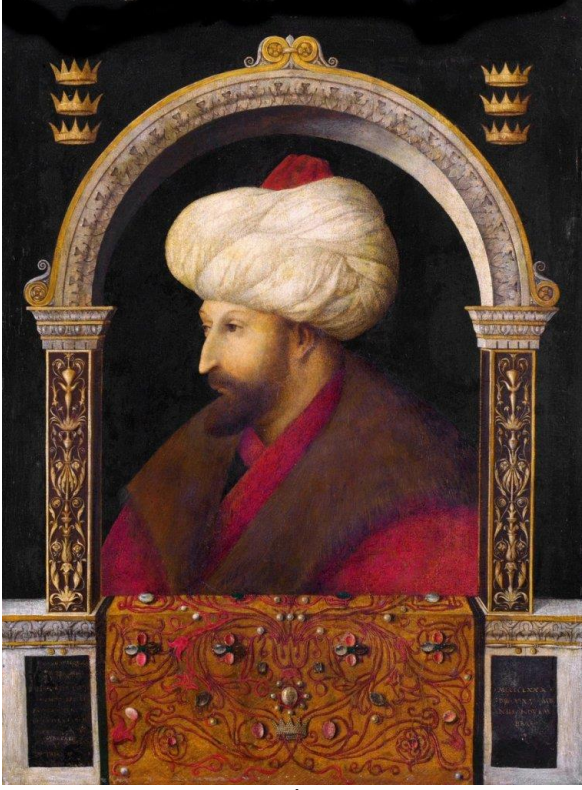
II. Mehmed'in (Fatih) İtalyan Ressam Gentile Bellini'ye Yaptırdığı 1479 Tarihli Portresi