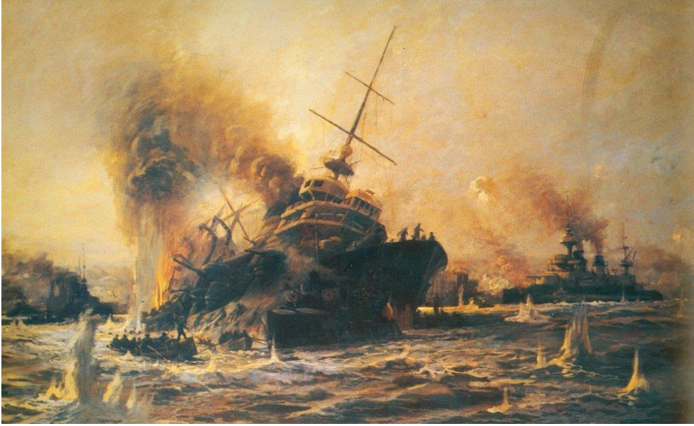
Bouvet'in Batışının Tasviri

atağa geçtiler. Saat 14'e doğru terazi İtilaf donanması tarafında ağır basıyordu. Çanakkale ve Kilitbahir kasabaları ateşler içinde, telefon hatları tahrip edilmiş, tabyalarla haberleşme kaybedilmiş, topların bir kısmı iş görmez hale gelmişti. Tam bu sıralarda savaşın seyrini değiştiren mühim bir olay gerçekleşti. Fransız Bouvet zırhlısı geriye doğru dönme hazırlığı yaparken, Türk topçusunun isabetli atışı neticesinde dakikalar içerisinde 600'den fazla mürettebatıyla birlikte Boğaz'ın derinliklerine gömüldü. Bu vaka, Türk tarafında büyük bir moral etkisi yaratırken, karşı tarafta aynı derecede ters etki yaptı.