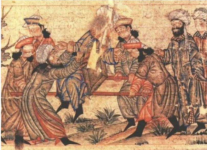
An agent of the Order of Assassins (left, in white turban) fatally stabs Nizam al-Mulk, a Seljuk vizier, in 1092, the first of many political murders by the sect. The faces in this depiction, which was contained in an illustrated 14th-century manuscript, were later scratched out.

1092 yılına geldiğimizde ise Nizamülmülk, Batiniler tarafından katledilmiştir. Kendisi bir muhaddis, siyaset adamı, müfessirdir. Bu sebeple, 1086'da oluşturduğu Siyasetname'sinin nasıl bir birikimden ve nasıl bir kültür içinden geldiğini anlamak önem arz etmektedir.