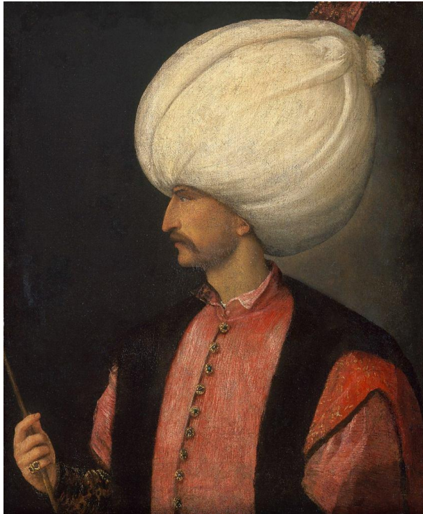
Kanuni Sultan Süleyman'ın Resmedildiği Bir Tablo

Belgrad'a yardımın ulaşmasını engellemekte, ağır araçların ve savaş ağırlıklarının taşınıp savaş bölgesine aktarılmasında, askeri birliklerin bir kıyıdan diğerine taşınmasında ve filodaki topçu kuvvetlerinin nehir tarafından yaptıkları katkılarıyla şehrin 1521 de ele geçirilmesinde İnce Donanma önemli bir rol oynamıştır. Türklerin ellerine geçtikten sonra Belgrad, Panonya vadisine ve Budin ile Viyana'ya doğru örgütlenen tüm eylemler için bir askeri kamp olmuştur. Macaristan'a düzenlenen altı büyük saldırı sırasında, Kanuni Sultan Süleyman'ın yanında Belgrad limanından çıkan Tuna filosu da bulunmuştur.[29]