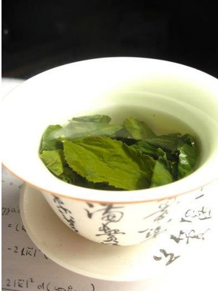
in Fincanında Yeřil ay Yaprakları

Mitler ve efsaneler farklı cođrafyalarda farklı tarzlarda zikrediliyor olsa da hepsinin ortak paydası ay bitkisinin kendine has kokusunun ve tadının zdeřleřtirilmesi abasıdır. Kltrler arasında bu kadar fazla pastoral tarzda ay efsanelerinin anlatılması ayın bu kltrleri ne denli etkilediđini gzler nne sermektedir.