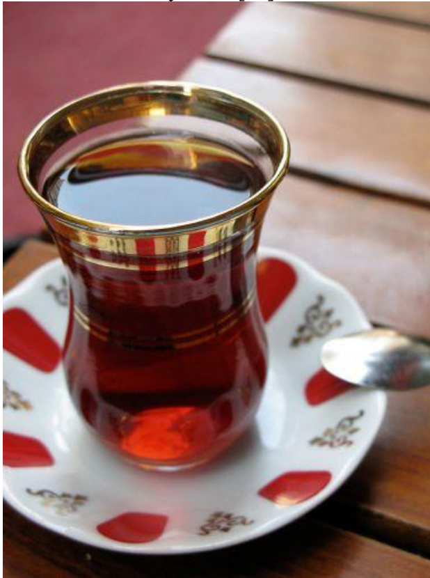
Klasikleşmiş Türk Usulü Çay Sunumu

Konumuzun dışına çıkacak olursak, Türkiye Cumhuriyeti’nin en önemli çaycısı Zihni Derin Bey’i anmadan geçemeyiz. 1923 yılında “ Ziraat Umumi Müfettişi ” olan Zihni Derin, Rize, Trabzon ve Artvin’de çay yetiştiriciliğinin bugünkü halini almasını sağlayan isimdir. Rusya ve Batum’daki zirai faaliyetleri inceleyip uygulayarak Cumhuriyet döneminde yeni çay yetiştirme usulünü geliştirmiştir. Onun ortaya koyduğu bu ekol hala günümüzde çay tarımının metotları arasında yer alır.[42]