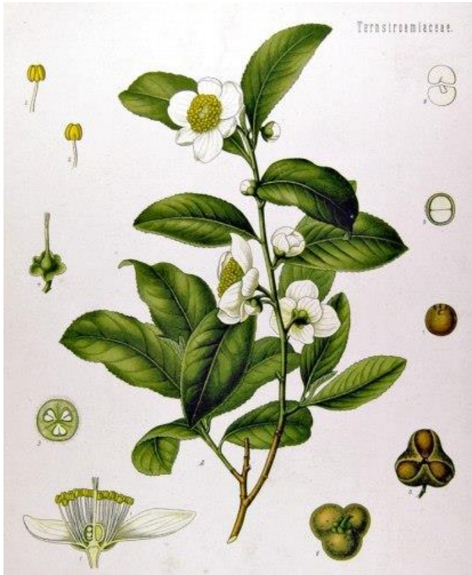
Köhler'in Şifalı Bitkileri'nden, Çay Bitkisi, 1897

Anadolu'ya ise çayın 12. ve 13. yüzyıllarda girdiğine dair bulgular mevcuttur. Anadolu'da beylikler şeklinde teşkilatlanan Türkler, Moğol istilaları sırasında yaklaşık 100 yıl boyunca Orta Asya'dan yoğun göç aldı. Çayın bu göç dalgasıyla Anadolu'ya girdiği düşünülmektedir. Ayrıca 13. yüzyılda abdalların ve dervişlerin Anadolu'ya rağbet edip tarikatlar kurarak buralarda teşkilatlanmalarıyla[15] da çayı Anadolu'ya getirmeleri muhtemeldir.[16] Osmanlı Devleti'nin gerek Ankara Savaşı'nın etkisinden sonra fetret devrinde, gerekse beylik savaşları sırasında 14. ve 15. yüzyıllardaki kaynak eksikliğinden dolayı kültürel anlamda da kaynak eksikliği oluşmuştur. Osmanlı tarih yazıcılığının fetihler ve savaşları konu alması bize çay konusunda bilgi yetersizliği sunar.