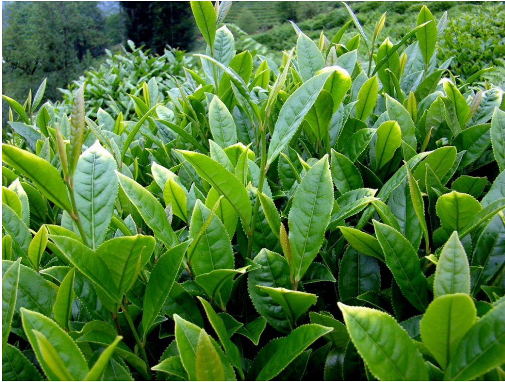
Toplanmaya Hazır Çay Filizleri

Asya'nın güneyinde çayı en çok tüketen sınıf olan çobanlara göre ise çayı koyunlar bulmuştur. Efsaneye göre çobanlar, koyunların çok hareketli ve zinde olduklarını görüp takip etmeye karar verirler. Koyunların yeşil yapraklı, hoş kokulu bir bitkiyi yediklerini görüp, zindeliğin kaynağının bu bitki olduğu konusunda karara varırlar. Çobanlar koyunların bu bitkiden daha fazla yemelerini sağlamak için bitkinin bol olduğu bölgelerde otlaklar yapmaya başlarlar. Şifacılar bu olayı duyunca yeşil yapraklı bitkileri kurutup, kaynamış su ile karıştırarak içmeye başladılar. Böylece çay bulunmuş olur.[8]