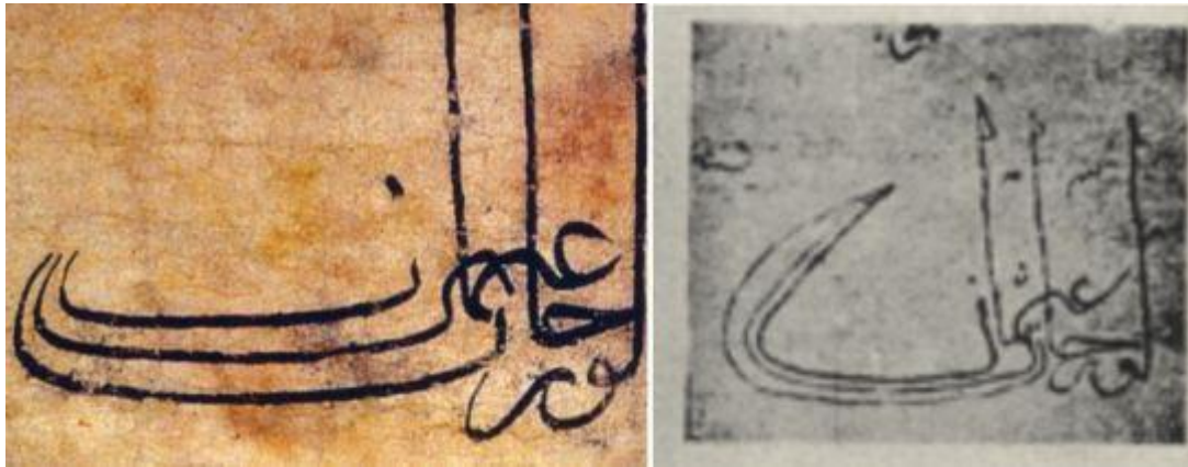
Orhan Gazi'ye Ait İki Tuğra[17]

İlk Osmanlı tuğrası, Orhan Gazi'ye ait olup "Orhan bin Osman" şeklindedir. Bu tuğra aynı zamanda daha sonraki Osmanlı padişah tuğralarının da temel şeklini belirlediğinden önem ihtiva etmektedir. Bu tuğralardan daha geç tarihli olan tuğrada "elif" (ل) harflerinin sağına eklenen zülfeler ile "nûn" (ن) harflerindeki genişleyen ve sağa doğru yönelen kavis, gelecekteki tuğraların da habercisi niteliğindedir.[16]