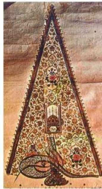
Kanuni Sultan Süleyman ve Sultan III. Mustafa’nın Tezhipli Tuğraları[21]

Tuğrada sülüs hat ile celi divani hattın karışımını ihtiva eden üsluplaştırılmış bir hat kullanılmaktaydı. Mustafa Rakım Efendi, kalem tutuş açısını değiştirerek harflerin kalınlık ve incelik değerlerini tespit ederek estetik açıdan harflerin ıslahını gerçekleştirmiştir.[22] Ahenksiz bir görünüme sebep olan harfler arası boşluklar da Mustafa Rakım tarafından düzenlenmiş, tuğranın iki yana sarkık nahoş görüntüsü de ortadan kalkmıştır. Buna ek olarak daha önce dik olarak meydana getirilen 3 elif (ل) harfi sola doğru yatık bir vaziyet kazanmıştır.[23] Tuğradaki temel değişiklik ise şekil kısmında meydana gelmiştir. Özellikle III. Murad tuğrasında ortaya çıkan üçgen şekli Mustafa Râkım’ın çektiği IV. Mustafa tuğrası ile yuvarlak bir hal almıştır. II. Mahmud döneminde sağ üst köşeye de mahlas eklemiştir. Bu dönemde tuğra estetik açıdan en olgun seviyeye ulaşmıştır.[24]