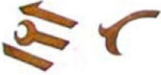
Yazıcızâde Ali'nin Selçukname Tercümesinde Yer Alan Kayı Tamgası[10]