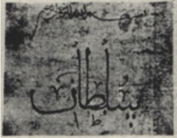
Bir Selçuklu Belgesinde Yer Alan "Sultan" İbaresini[12]

Selçukluların ardından kurulan Anadolu beyliklerinde görülen tuğraların birbirlerine olan benzerliği de dikkat çekicidir. Özellikle Orhan Gazi, I. Mehmed, Karamanoğlu İbrahim Bey ve Candaroğlu Kasım Bey'in tuğraları bu konuda önemli bir örnek olarak incelenebilir. Bu tuğraların, yüz yıl öncesine ait olan Memlüklü sultanlarının tuğraları ile karşılaştırılması, tamamen farklı bir tasarımın ürünü olduğunu açıkça ortaya koymaktadır. Bu durum, Anadolu beyliklerinin tuğralarında Selçuklu etkisinin bir diğer göstergesi olarak da yorumlanabilir. Konu hakkında Midhat Sertoğlu, Hammer'den naklen verdiği bilgide tuğranın ortaya çıkışını I. Murad dönemine bağlayan iddiaya itibar edilmemesi gerektiğini ifade etmektedir. Zira burada I. Murad'ın okur-yazar olmadığı ve tuğrasını, elini mürekkebe batırıp kâğıda basmasıyla hazırladığı gibi bir iddia söz konusudur.[11]