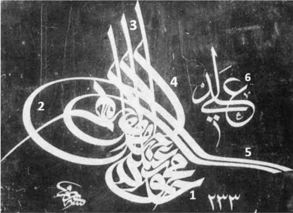
Tuğranın Bölümleri: 1- Sere, 2- Beyze, 3- Tuğ, 4- Zülfe, 5- Kollar, 6- Mahlas

Tuğralar temel olarak beş ayrı bölüme ayrılmaktadır. 19. yüzyıldan itibaren tuğraya eklenen mahlas, tuğra metninin dışında, genellikle tuğranın sağ üst kısmında yer almıştır.