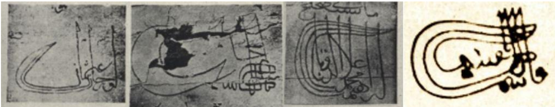
Soldan Sağa: Orhan Gazi, I. Mehmed, Karamanoğlu İbrahim Bey ve Candaroğlu Kasım Bey'in Tuğraları[13]