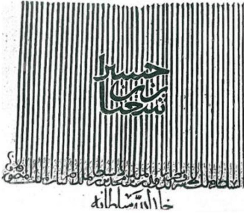
Memlük Sultanı el-Melikü'l-Eşref Şaban'ın Tuğrası[14]