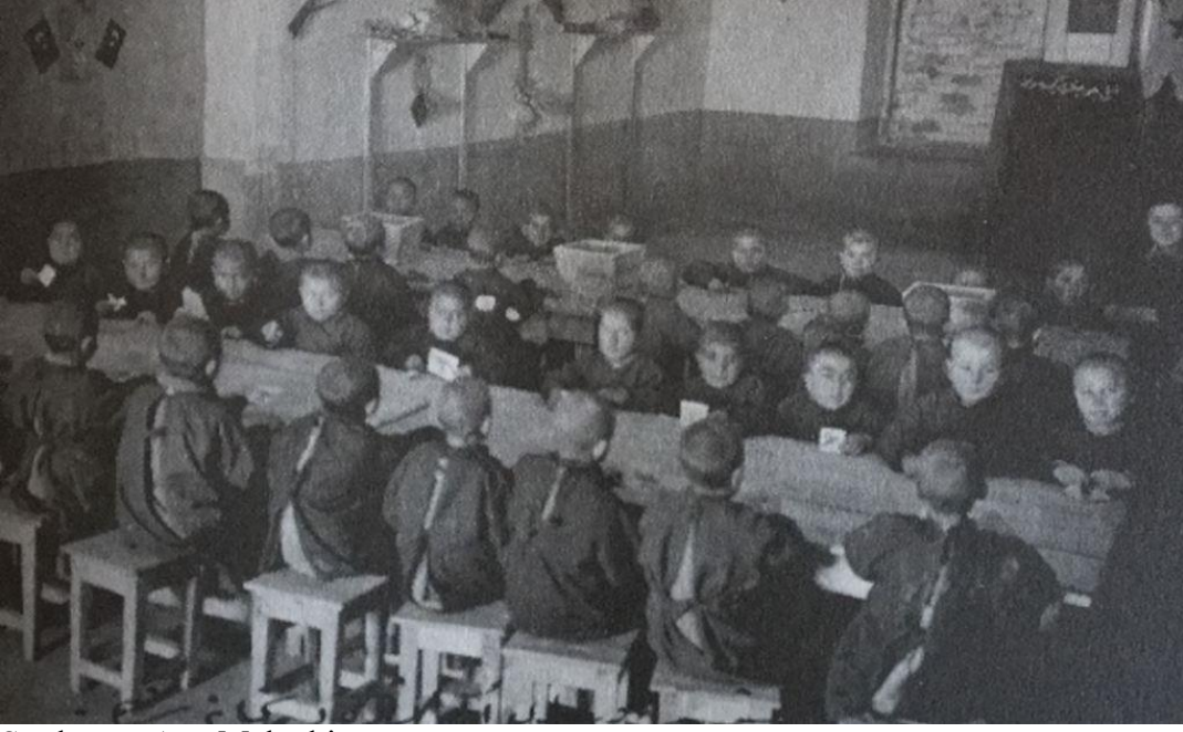
Sarıkamış Ana Mektebi

Modern ismine aşına olduğumuz bugünün anaokulu, o günlerin ana mektebi bu devrede çocuğa, ileride sağlığını, psikolojik gelişimini olumlu yönde etkileyebilecek bazı melekeleri kazandırma gayesi içerisinde olmalıdır. Bunlara göre anaokulunun amacı iki yönlü olmaktadır: İlkokula hazırlamak ve hayata hazırlamak.[29]