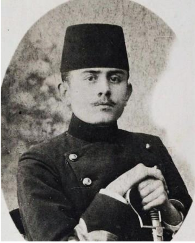
General Kazım Karabekir, 1318 (1902) Senesinde Harbiye Mektebi'nin Üçüncü Sınıfındayken

Eğitim süreci içerisinde başarılı bir öğrenci olduğu bilinmekle beraber, cepheden cepheye koşan ömründe zamanını okuma ve yazma ile değerlendiren bir insandı. Aynı şekilde Genelkurmay arşivlerinde de cepheye kitap sipariş ettiğinin örnekleri mevcuttur.[5] Onun milli tarih bilincinin gelişmesinde yapmış olduğu okumalar, daha sonra kaleme almış olduğu eserlerde hissedilmektedir.