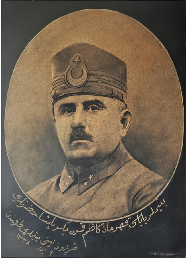
“Yetimler Babası Kazım Karabekir Paşa Hazretlerine Trabzon Ermeni Yetimleri Tarafından 9 Eylül 1338”