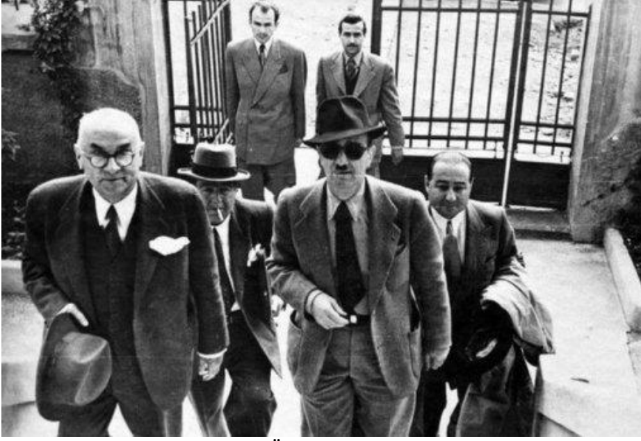
Demokrat Parti'nin 4 Kurucu Üyesi: Celâl Bayar, Refik Koraltan, M. Fuad Köprülü, Adnan Menderes