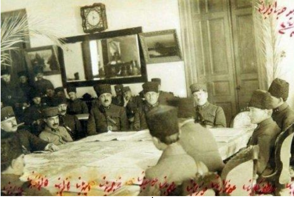
Atatürk ve Generaller Aynı Masada (İzmir Harp Oyunları, 15 Şubat 1924)