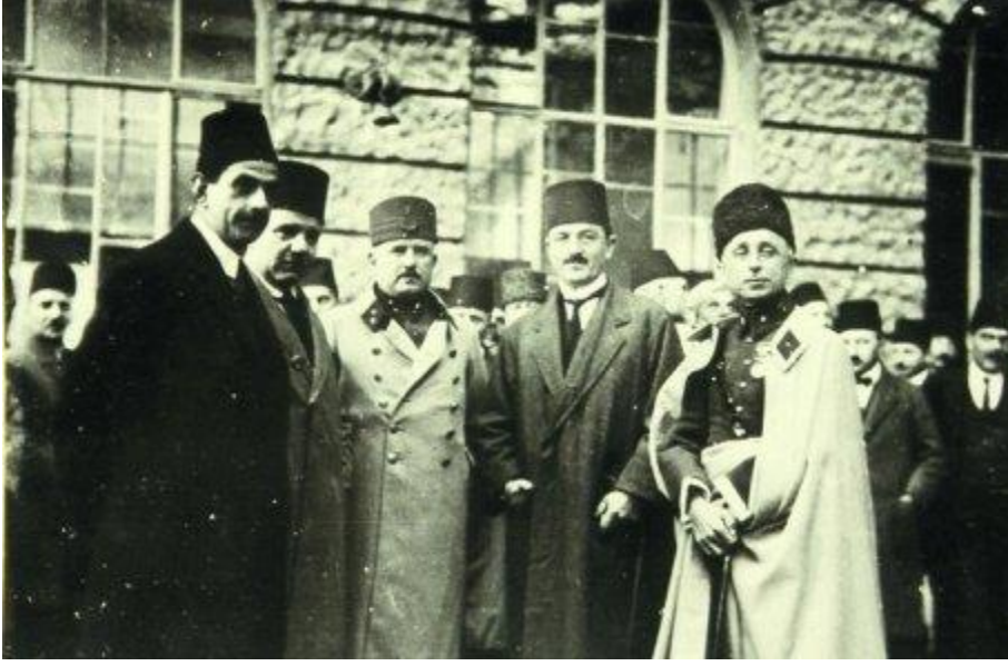
Terakkiperver Cumhuriyet Fırkası'nın Kurucuları: Adnan (Adıvar), Ali Fuat (Cebesoy), Kâzım Karabekir, Rauf (Orbay) ve Refet (Bele)

İzmir Suikasti, teşebbüs aşamasına bile gelmeden ihbar üzerine açığa çıkarılarak, davanın yargılama süreci başlayacaktı. Terakkiperver'in üst düzey yöneticilerinin de yargılandığı bu davadan sonra muhalefetin varlığı pasif hale getirilecekti. Sonuç olarak sindirilen bir muhalefet girişimi ardından başarısız bir suikast teşebbüsü Mustafa Kemal Atatürk'ün elini daha da güçlendirecekti.