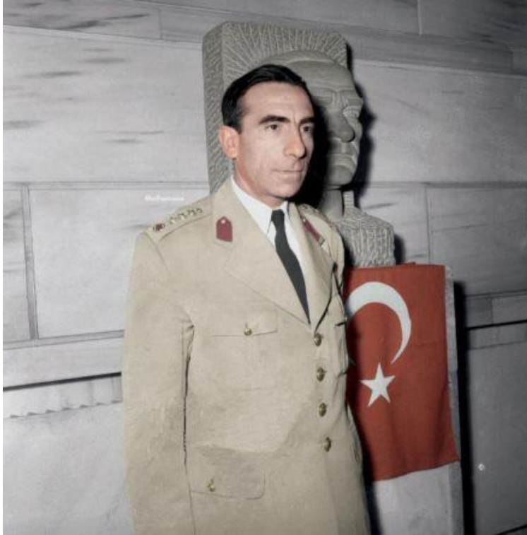
Alparslan Türkeş, Atatürk Büstü Önünde