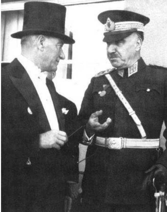
Türkiye Cumhuriyeti'nin İki Mareşali, Mustafa Kemal Atatürk ve Fevzi Çakmak Paşalar Aynı Karede

Öz itibariyle İnönü, 1930'ların siyasi sistemini, ideolojik bağlanmalarını ve ordunun bunlar içindeki konumu korudu. En büyük sınavı İkinci Dünya Savaşı'nın patlak vermesiyle gelip çattı. 1945'e kadar tarafların güçlü baskılarına karşın Türkiye'nin tarafsızlığını sürdürmeyi başardı. Krizin üstesinden gelmek için savaş yıllarında İstanbul'da sıkıyönetim ilan edildi; ordu teyakkuza geçirildi (H. William, 2014: 122).