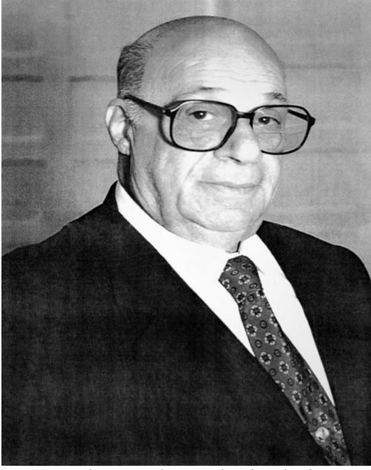
Kuzey Kıbrıs Türk Cumhuriyeti'nin Kurucusu ve İlk Cumhurbaşkanı Rauf Raif Denktaş

Nihayet Makarios, 5 Ağustos 1963 tarihinde Zürih ve Londra antlaşmalarını kendi iradesi dışında imzaladığını, anayasanın değiştirilmesi gerektiğini dile getirmiş ve 30 Kasım 1963 tarihinde de Türkiye Cumhuriyeti hükümetine on üç maddeden oluşan bir anayasa değişikliği taslağı sunmuştur. Kıbrıs Cumhuriyeti anayasasına tamamen aykırı olan bu taslakta, cumhurbaşkanı ve yardımcısının veto haklarının kaldırılması, seçimlerinin ilgili toplum tarafından değil Temsilciler Meclisi'nin tümünce yapılması, ayrı belediyelere ve yargı organlarına son verilmesi istekleri dikkat çekmektedir.[20] Bu taslağın kabul edilmesi adadaki Türkleri tamamen azınlık durumuna getireceğinden Türkiye Cumhuriyeti tarafından reddedilmiştir.