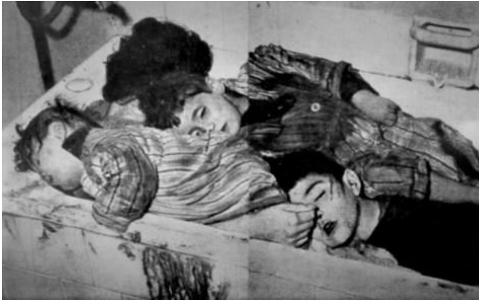
Kanlı Noel Olaylarında Anneleriyle Birlikte Katledilen Türk Çocuklar

1974 Kıbrıs Barış Harekatı’ndan önce, Türkleri ekonomik bakımdan çökertmek, göç ettirmek ya da teslim olmalarını sağlamak amacıyla Rum-Yunan ikilisi her çeşit ambargoyu Türk halkına karşı uygulamıştır. Rum liderliği, bu süre içinde “kritik malzeme” diye vasıflandırılan 37 çeşit ürünün Türk bölgesine girmesini yasaklamış, Türk kesimlerine su, elektrik, telefon hizmetleri vb. vermemiş, Türklerce üretilen ürünler tahrip edilmiş, Türk bölgelerine yatırım ve kredi verilmemiş ve Kıbrıs Türk halkını ekonomik çöküntü içine itmiştir.