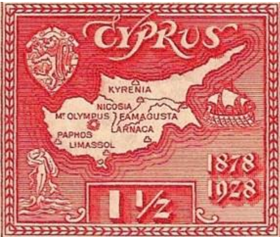
Kıbrıs'ın İngiliz Hakimiyetinde Geçirdiği 50. Yılı Kutlamak İçin Bastırılmış Bir Pul

Osmanlı Devleti'nin Rusya ile imzalamış bulunduğu Ayestafanos Antlaşması'nın Batılı devletler tarafından tepki çekmesi, Berlin Konferansı'nın toplanmasına sebep olmuş ve özellikle Hindistan'daki sömürgelerini kontrol altında tutmak isteyen İngiltere; Osmanlı Devleti'nin yaşamış olduğu krizi kendi siyasi emelleri açısından bir fırsata dönüştürmeyi başarmıştır. İngiltere, Anadolu'ya yönelik muhtemel bir Rus istilasına karşı Osmanlı Devleti ile savunma ittifakı yapacağı teminatını vererek Kıbrıs'ın bir askeri üs halinde kendisine bırakılmasını istemiş ve devamında zor durumdaki Osmanlı hükümeti, 4 Haziran 1878'de İngiltere'nin fiilen adaya yerleşmesine zemin hazırlayacak olan anlaşmayı imzalamıştır.[2] Böylece İngiltere, Doğu Akdeniz'deki hakimiyetini güçlendirmekle kalmamış, aynı zamanda Rusya'yı da denetleme imkanı bulmuştur.