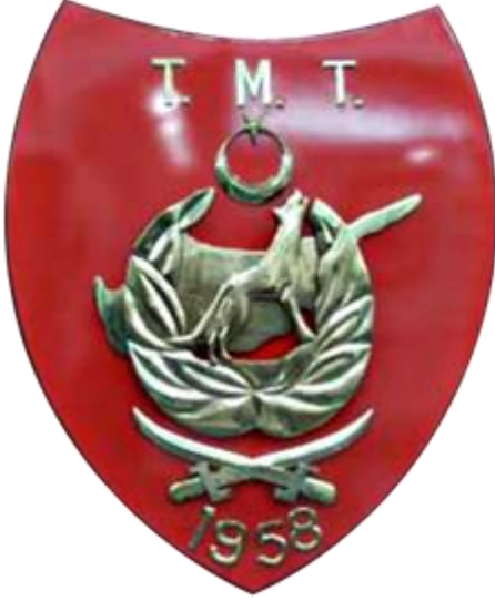
Türk Mukavemet Teşkilatı'nın Amblemi