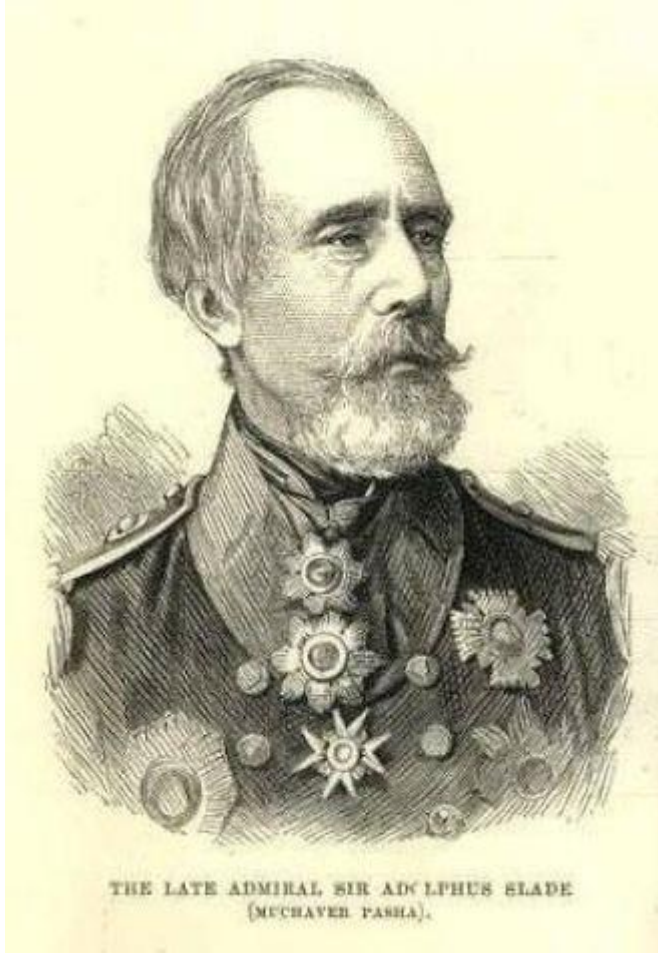
Sir Adolphus Slade

çıkan bir haberde, hem Slade'in Osmanlı deniz üniforması içerisinde bir resmi hem de onu hayli övücü ifadeler mevcuttur.[19]