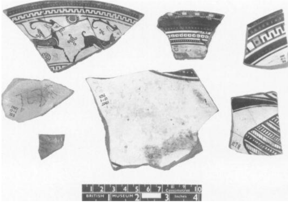
MÖ 600-550 Yıllarında Sardeis ve Ephesos'ta Görülen Eşyalar[22]

kapları, siyah figürlü Atina hydria, alabastron ve skyfosları, Lakonia kapları, Korint aryballos, alabastron, skyfosları verilebilir.[21] Bazı dışalım malları ise altın, gümüş, parfüm, krem, tekstil, boya gibi Lydia malzemeleriyle değiş-tokuş yapılarak ticaret gerçekleştirilmiştir. Fakat değiş-tokuş Lydialılar tarafından paranın basılmaya başlamasıyla yerini yavaş yavaş paraya bırakmıştır. Bu bölümde incelediğimiz konu itibariyle Lydialılar ve İonialılar arasındaki siyasi ve ticari ilişkiler bu şekilde gelişmiştir.