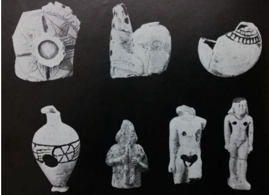
Fayans Heykelcikler (MÖ 600-550 Sıraları) 1948-51 Kazılarında Tapınakta Bulunmuştur[44]