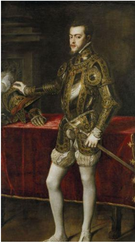
İspanya Kralı II. Felipe

Sonuç olarak II. Felipe döneminde de daha önce kurulan konsiller yaygınlaştırılarak artmaya devam etti. [16] Fakat önemle belirtmemiz gerekir ki onun yönettiği İspanya, İber Yarımadası'ndan ibaret bir krallık değildi. O, Amerika'dan İtalya'ya Hollanda'dan Asya'ya kadar büyük bir imparatorluğu yönetiyordu. Bu nedenle konsiller sistemini kendi amacına hizmet noktasında en isabetli tarz olarak gördüğü ve yaygınlaştırdığı anlaşılıyor. Öte yandan konsillerin dışında Genel Vali makamının da merkez ile yerel konsiller arasında bir aracı olarak Portekiz ve Flandre Konsili örneklerinde olduğu gibi uygulandığını görüyoruz. [17] Felipe'nin büyük imparatorluğunun kontrolünü daima elinde tutma isteği onu sıkı bir bürokratik denetim mekanizmasını oluşturmaya ve kendisini de bunun merkezine almaya itmiş gibi gözüküyor. Ayrıca Felipe, özellikle idari mekanizmayı oluşturan bürokratik işleyişin her alanında bilgi sahibi olmaya da özen göstermiş benziyor. [18] O, bilgiye öylesine değer veriyordu ki 1576 yılında Amerika'daki memurların cevaplaması için çeşitli sorular hazırlattı. [19] Amerika kolonisinde işlerin nasıl yürüdüğünden ve ne olup bittiğinden dahi haberdar olma kaygısı onu idari anlamda nasıl bir sistem ve tarza yöneltmiş olduğunu anlamamızı sağlayabilir. Bu tarz ise İspanya için uzun bir süre kalıcı olacak sistemin bizzat kendisiydi. Onun ölümünden sonra da uzun bir süre devam etti.