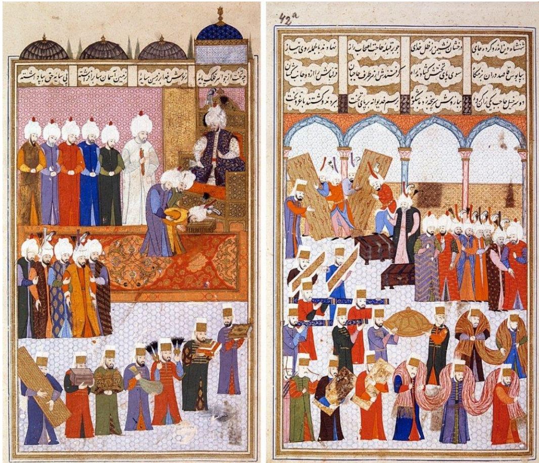
İran Elçisi Tokmak Han'ın Divan-ı Hümayun'a Gelmesi ve Huzura Kabulü (TDVİA)

Diğer bir yandan reaya, toplumsal statü farkı gözetmeksizin doğrudan doğruya divana başvurabildiği gibi kadılar aracılığı ile de arz-ı mazhar denilen bir tür resmi başvuru yoluna gidebiliyorlardı. [40] Özellikle Anadolu'daki asayiş bozukluğunun doruk noktasına ulaştığı Celali isyanları sırasında kadı aracılığıyla reyanın divana oldukça fazla arz-ı mazhar göndererek yöneticileri ve eşkiyaları doğrudan devlete şikayet etmişler ve bunun sonucunda sultan adaleti tesis etmek adına adaletname adı verilen çeşitli fermanlar yayınlanmıştı. [41] Sonuçta devletin adaleti sağlamak gibi en kadim görevinin farkında olduğu anlaşılan Türk-İslam devlet anlayışının, sistemin merkezinde yer alan divan kurumuna adaleti sağlama noktasında başlıca yetkili olarak bir paye vermesi pek şaşırtıcı değildir. Divan, devletin en üst karar organı olarak aynı zamanda bu yönüyle zaman zaman, doğrudan adaleti sağlayan bir üst mahkeme olarak da kabul edilebilir.