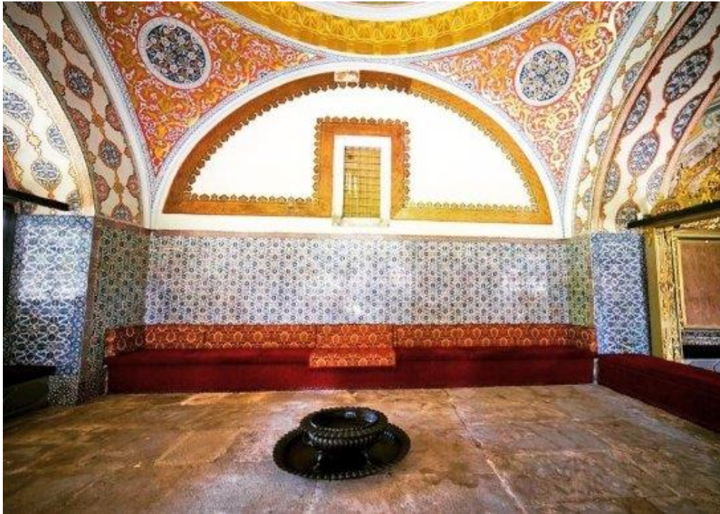
Kanuni Döneminde Topkapı'da İnşa Ettirilen ve Günümüze Ulaşan Kubbealtı Divanhane, Divan-ı Hümayun

Divan-ı hümayun organının asil üyeleri arasında sultanın toplantılardan çekilmesinden sonra kurulun başkanlığını üstlenen vezir-i azam, kubbe vezirleri, Anadolu ve Rumeli kadiaskerleri, nişancı ve defterdarların yanı sıra yardımcı üyeler olarak reisülküttab, çavuşbaşı, tezkireciler ve kapıcılar kethüdasını sayabiliriz. [33] Bunların yanı sıra Yeniçeri ağası ve kapudan-ı derya eğer vezir rütbesinde ise divanın ana üyeleri olarak toplantılara katılabiliyorlardı. [34] Rumeli Beylerbeyi makamı ise Kanuni Sultan Süleyman zamanında vezir-i azam İbrahim Paşa'ya tevdi edilmiş ve bu makamdakilerin divana katılmasına böylece olanak sağlanmıştır. [35] Şeyhülislam ise, doğrudan divan kurulunun bir üyesi değilse de hükümette sözü ve nüfuzu olduğunu inkar edemeyiz. [36]