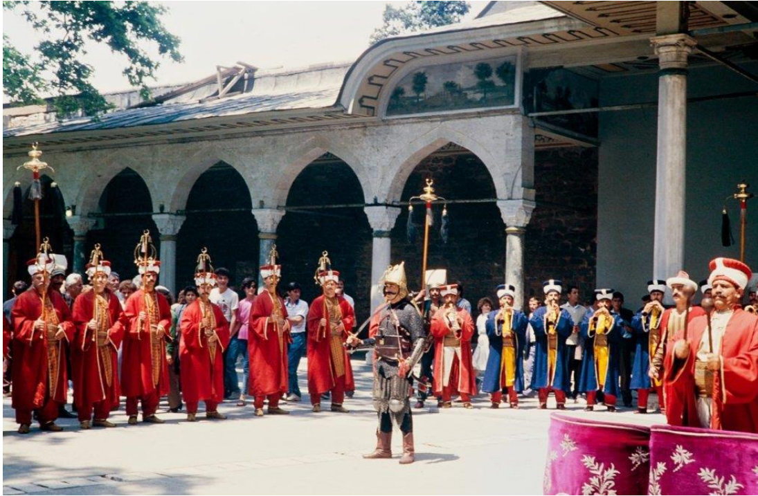
Topkapı Sarayı'nda Bir Mehter Gösterisi (TDVİA)

Çeşitli devirlerde 187 ile 237 arasında değişen üyesiyle ifade edilen Mehterhane-i Amire, İstanbul'un fethinde en geniş kadrosu ile (300 kişi) karşımıza çıkmaktadır. Genellikle yaya birliklerden oluşan mehter takımını bu dönemden itibaren atlı birlik olarak da görmekteyiz. Fatih'in bu konuda yaptığı icraatlardan biri ise İstanbul Demirkapı'da Nevbethanekurmasıdır.[8]