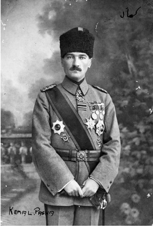
Mustafa Kemal Paşa (1918)

İstanbul'da bulunduğu sırada Sultan Vahdettin ile görüşen Mustafa Kemal Paşa, bu görüşmelerden umduğunu bulamayacaktı. Artık Anadolu'ya geçerek Milli Mücadele'yi başlatmak yapılacak tek şeydi. Ancak iki önemli ismin desteği Mustafa Kemal Paşa'nın milli mücadeleyi başlatması için vazgeçilmez öneme sahipti; merkezi Ankara'ya nakledilen 20. Kolordu Kumandanı Ali Fuat (Cebesoy) Paşa ve Erzurum'daki 15. Kolordu Kumandanlığı'na atanan Kazım Karabekir Paşa. Mustafa Kemal Paşa bu iki kişinin desteğini almıştı. İstanbul'da buldukları sırada Mustafa Kemal Paşa'nın Şişli'deki evinde görüşmeler gerçekleştirdiler. Jandarma Umum Kumandanı Miralay Refet (Bele) Bey, eski Bahriye Nazırı Rauf (Orbay) Bey gibi isimlerin de katıldığı bu görüşmelerde direnişin tohumları atıldı. Nitekim Ali Fuat ve Kazım Karabekir Paşalar, Mustafa Kemal Paşa'nın Anadolu'ya geçmesi durumunda ona gereken desteği sağlayacakları hususunda söz verdiler.[4] Artık mesele, hükümete ve İngilizlere asıl niyetini belli etmeden Anadolu'ya ayak basmaktı.