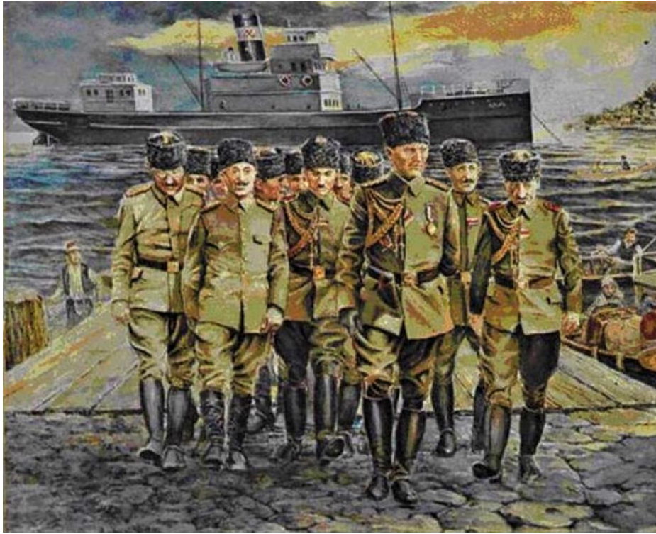
Mustafa Kemal Paşa ve Heyetinin Samsun'a Çıkışı