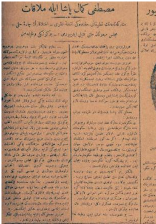
Vakit Gazetesi, Mustafa Kemal Paşa Demeci 18 Teşrinisani 1334 (1918)