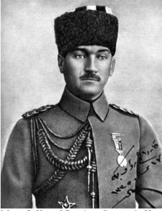
Mustafa Kemal Paşa'nın Samsun'a Hareketinden 28 gün Önceki Fotoğrafi (Kardeşim Rauf Bey'e, 17 Nisan 1919)

İtilaf kuvvetleri Bırakışma'nın tartışmaya oldukça açık 7. maddesi uyarınca kısa zaman zarfında işgale başladılar.[8] 8 Kasım günü Musul 9 Kasım günü İskenderun ve Çanakkale Boğazı işgal edildi. 13 Kasım 1918 günü müttefik kuvvetleri İstanbul'u gayriresmi (de facto) olarak işgal ettiler. 13 Kasım 1918 günü aynı zamanda Mustafa Kemal Paşa'nın İstanbul'a cepheden geldiği gündür.