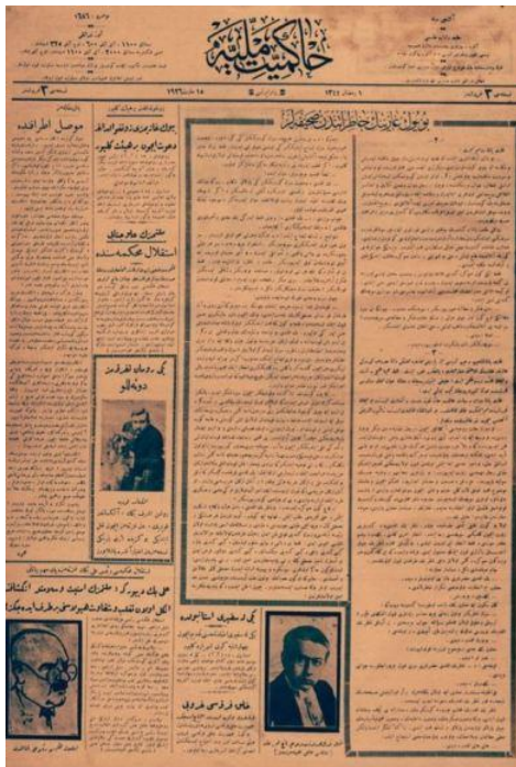
Hakimiyet-i Milliye Ramazan Sayı: 1686 Yıl: 1926, Mart 15