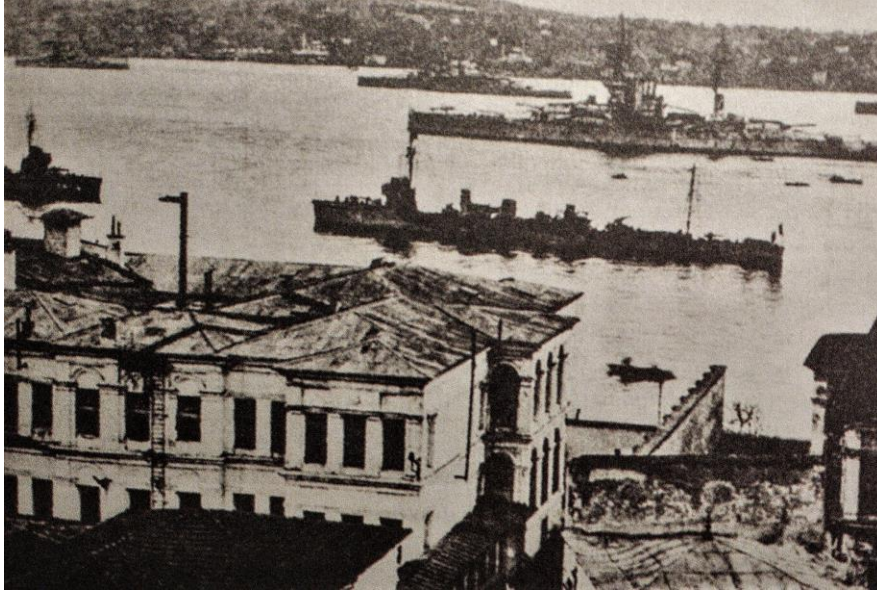
İtilaf Devletleri Donanması İstanbul'da Meclis Binasının Önünde

Mustafa Kemal Paşa, 11 Kasım gecesi Adana'dan trenle yola çıkıyor ve dediğiniz gibi 13 Kasım'da İstanbul'da oluyor. İstanbul'daki manzara hiç de iç açıcı değildi. Savaşı kazanan İtilaf donanması Çanakkale'yi geçerek o gün İstanbul Boğazı'na gelmişti. Üç yıl önce Çanakkale'de düşmanlarını yenen bir komutan, şimdi onların boğazdan geçtiğini görüyordu. Ve o meşhur "Geldikleri gibi giderler!" sözünü de burada söyleyecektir.