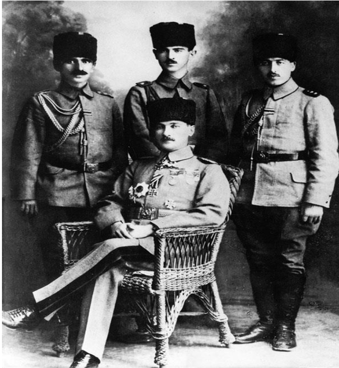
Yıldırım Orduları Kumandanlığına Tayin Edilen Yedinci Ordu Kumandanı Mustafa Kemal Paşa, Halep'te Yaverleriyle Birlikte

Kamuoyunca “Anafartalar Kahramanı” olarak bilinen Mirliva Mustafa Kemal Paşa, savaşın son aylarında Suriye cephesinde görev yapıyordu. Ağustos 1918 ortalarında 7. Ordu Komutanlığı görevine atanmıştı ve ayın sonlarında Halep'te görevinin başındaydı. Yaptığı teftişlerde ordunun zayıflığını ve cephanenin yetersizliğini bizzat görmüş ve çözümü daha fazla kuvvet kaybetmemek adına kademeli olarak kuzeye çekilmekte bulmuştu. Yıldırım Grubu Komutanı Liman von Sanders'in onayı ile de Ekim 1918 başlarında Halep'e kadar çekildi. Bu sırada Talat Paşa kabinesi çekilmiş ve İzzet Paşa kabinesi kurulmuştu. Mustafa Kemal, bu yeni kurulacak kabinede Harbiye Nazırı olarak görev alabileceği mesajı vermekteydi. Lakin kurulan hükümette ismi yer almayacaktır. Mütarekenin imzalandığı gün ise Mustafa Kemal, Liman von Sanders'in yerine Yıldırım Orduları Grup Komutanı olarak tayin edildi. Mustafa Kemal bu görevde ancak bir hafta kalabildi. Çünkü 7 Kasım 1918'de Yıldırım Orduları Grup Komutanlığı lağvedilecektir. Bu haber ise Mustafa Kemal'e 10 Kasım'da ulaştı. Bunun üzerine emrindeki birlikleri 2. Ordu Komutanı Nihat Paşa'ya devrederek, İstanbul'a dönme hazırlıklarına başladı.