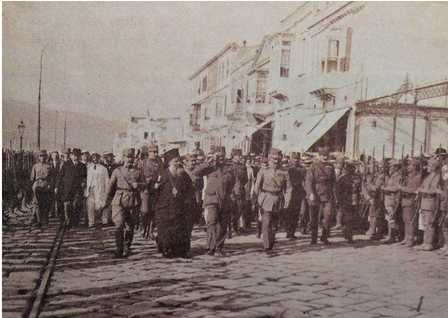
İzmir'i İşgâl Eden Yunanlar, Ordu Mensupları ve Din Adamlarıyla Beraber Kordonboyu'nda İlerliyor (1919)