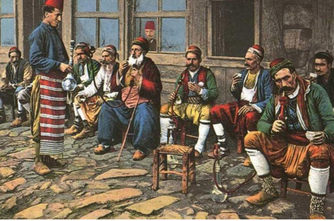
19. Yüzyılda Bir Osmanlı Kahvehanesi

Öte yandan yüksek gelir grubuna sahip kimseler o zamana dek evlerinde yer alan “selamlık” bölümünde konuklarını ağırlayabiliyorlardı. Fakat selamlık ayrı bir bölüm olsa da evin fiziki yapısına dahil olduğundan dolayı, ev sahibi mahremini riske atmak yerine kahvehaneyi tercih etmeye başlamıştır. Zaten kahve ve kahvehane Osmanlı toplumunun gelir durumuna göre lüks bir aktivite değildi. Peçevi’ye göre: “ Ahbab toplantıları yapmak için büyük paralar harçayarak ziyafetler çeken kimseler, artık bu masraftan kurtulup bir iki akçe kahve parası vermekle toplantı safasını sürmeye başladılar. ” Görüldüğü gibi kahvehane ekonomik olarak uygun bir fiyata sosyalleşme imkanı sunuyordu. Bu yönüyle de toplumun tüm sosyo-ekonomik kesimlerinden insanların kolaylıkla ulaşabildikleri bir aktiviteydi. Sonuç olarak kahvehane ucuz, pratik ve yeni bir mekandı.