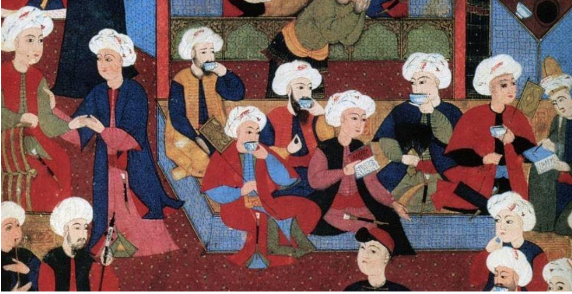
16. Yüzyılda Osmanlı Kahve Meclisini Anlatan Bir Minyatür