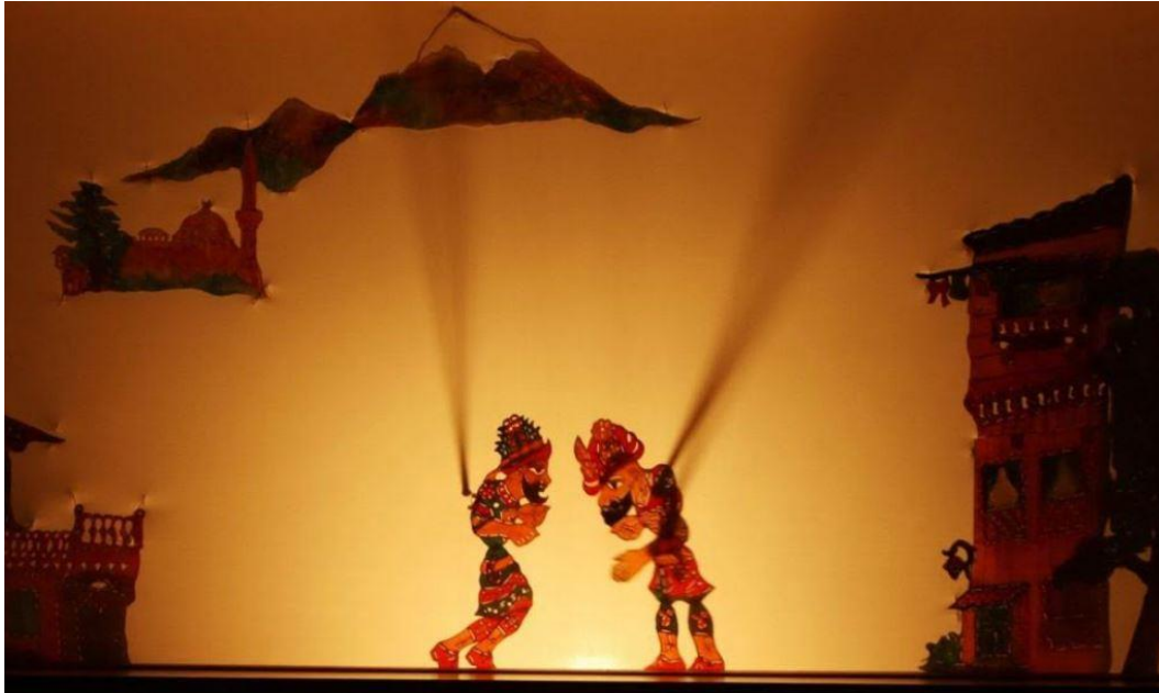
Türk Halk Kültürünün En Özgün Ürünü ve Kahvehanelerin Vazgeçilmez Eğlencesi Olan Karagöz ve Hacivat Oyunu

Gerçekten de kahvehane her zaman kahveden daha fazlasını sağlayabilen mekanlardı. Karagöz-Hacivat, meddah gösterileri, orta oyunu, çeşitli müzikli eğlenceler ve satranç, tavla gibi oyunlar kahvehane müdavimleri için bekliyorlardı. Aynı zamanda kahvehanelerin Türk halk kültürünün önemli bir parçası olan aşık geleneğinin gelişimine de derin tesirleri oldu. Aşıklar saz eşliğinde şiir okuyan Türk halk kültürünün en önemli unsurları olarak günümüzde de varlıklarını sürdürmektedir. Bunlar kahvehaneler vasıtasıyla hünerlerini gösterecekleri bir mecraaya eriştiler. Zaten aşık geleneğinin özellikle on altıncı yüzyılda önemli bir ivme kazanması yine aynı dönemde Osmanlı toplumunun hayatına giren kahvehanelerin etkisiyle de açıklanabilir. Yine müzikli eğlencenin kahvehanelerde olduğunu biliyoruz. Fakat bunların kahvehaneler için meyhanedeki müzikli eğlenceleri çağrıştırdığı düşünülduğünden pek tercih edilmediği anlaşılıyor.