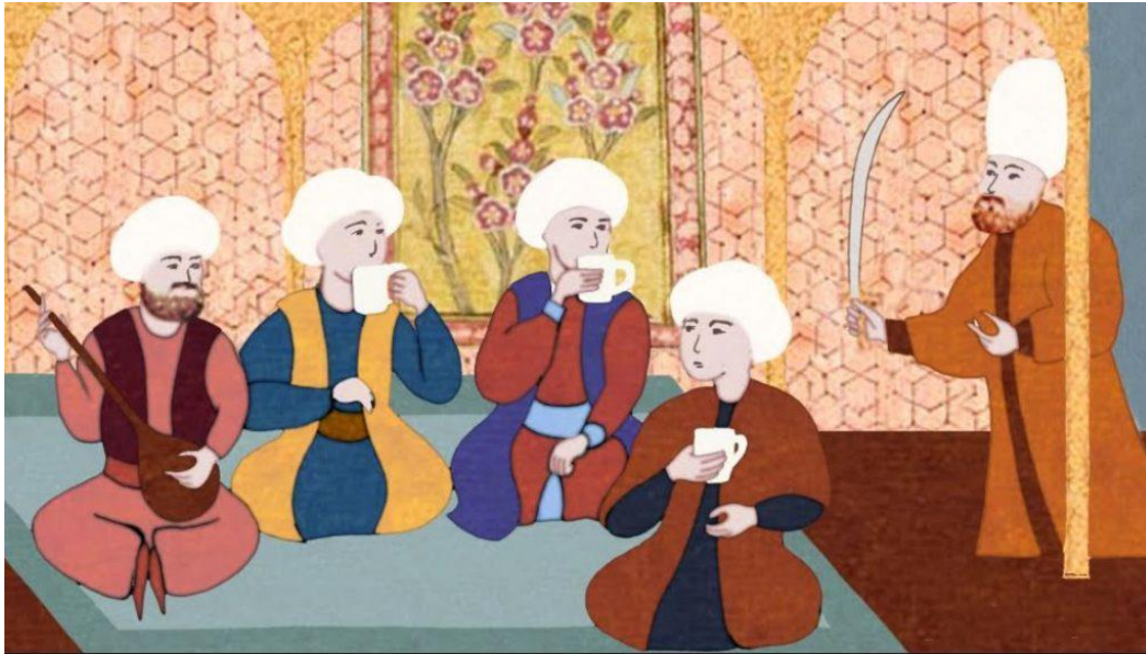
Devletin Kahvehanelere Karşı Katı Tutumu Yansıtan Bir Minyatür Kahve İçip Sohbet Eden Ahali ve Başlarında Elinde Kılıçla Bekleyen Devleti Simgeliyor

Ulema açısından ise konunun ciddiyeti biraz farklıydı. Onlara göre toplumsal düzen kahvehaneler eliyle artık bozulmuş, insanlar camiye gitmeyi bırakıp kahvehanelere gitmeye başlamıştı. Muhtemelen ulemanın bu yaklaşımı dini olmaktan çok siyasi bir yaklaşım ve devlet destekli bir söylemdi. Sonuçta insanlar kahvehanelerde dini bir yozlaşmadan daha çok eleştirel bir siyasi söylem geliştirme imkanı buluyorlardı. Bunun ulema açısından herhangi bir sakıncası mesele edildiği şekliyle olmasa gerek.