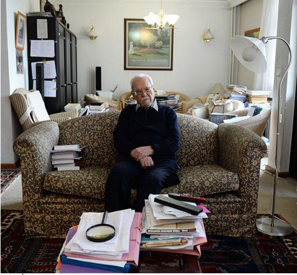
Halil İncalcık'ın Evinde Çekilmiş Bir Fotoğrafi

İncalcık, II. Murad ve Fatih dönemlerine ait tahrir defterlerine dayanarak, Balkanlarda Osmanlı yayılışının tamamıyla muhafazakâr ( conservative ) bir karakter taşıdığını, ani bir fetih ve yerleşmenin söz konusu olamayacağını, eski Bulgar, Rum, Sırp ve Arnavut asil sınıfları ve askeri zümrelerinin yerlerinde bırakılarak mühim bir kısmının Hıristiyan tımar erleri olarak Osmanlı tımar kadrolarına sokulduğunu ve hiçbir şekilde bir İslamlaştırma politikası güdülmediğini ispat etmiştir.