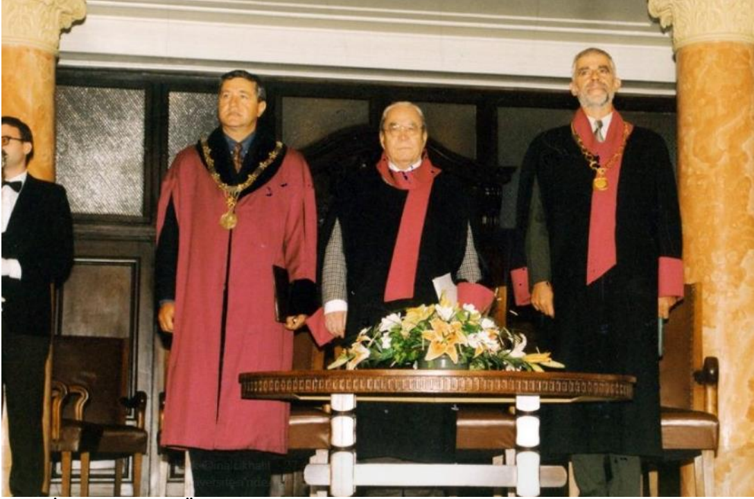
Halil İnalçık, Sofya Üniversitesi'nde Fahri Doktora Töreninde (2001)

İnalçık'ın eserlerinde göze çarpan en önemli özelliklerden biri, bu çalışmaların temelini arşiv belgelerinden elde edilen özgün verilerin oluşturmasıdır. Osmanlı arşiv belgelerinin önemini daha işin başındayken farkederek İnalçık, bu belgeleri kendi geliştirdiği metotlarla tahlil etmiştir. Şunu da belirtmeliyiz ki, o dönemde Osmanlı arşivleri bugünkü gibi sistemli bir tasniften yoksundu. İnalçık bu koşullarda arşiv belgeleri üzerinde çalışarak Osmanlı tarihini yeni baştan inşaa edecektir. O, bu süreci şu ifadelerle belirtir, “ Açık olarak görülmektedir ki, Türk arşivlerindeki vesikalar, Osmanlı devletinin Balkanlarda yayılışı hakkında bazı görüşleri esasından değiştirecek mahiyettedir. Osmanlı İmparatorluğunun son asrında, Balkan milletlerinin isyan ve istiklal hareketleri esnasında revaç bulan müfrit ve mutaassıp görüşlerin yavaş yavaş yumuşadığını, hatta bazı cesur yazarlar tarafından tamamıyla reddedildiğini biliyoruz. Artık ciddi hiçbir tarihçi, Osmanlı hâkimiyetinin yerli idareci ve askeri sınıfları, asilleri ya kılıçtan geçirmek yahut zorla İslamiyet'e sokmak suretiyle ortadan kaldırdığını ve onların yerine imtiyazlı feodal bir hâkim sınıf olarak Müslüman Türklerin gelip yerleştiğini iddia etmiyor ”.