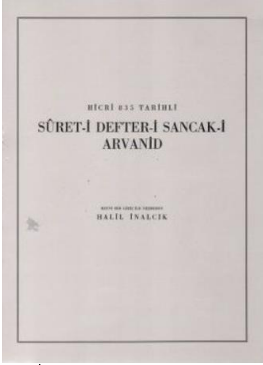
Halil İnalçık: Sûret-i Defter-i Sancak-i Arnavid

1954'te yayınlanan " Stefan Duşan'dan Osmanlı İmparatorluğu'na: XV. Asırda Rumeli'de Hıristiyan Sipahiler ve Menşeleri " adlı çalışması, ilmi çevrelerde büyük bir yankı uyandırdı. İnalçık, Balkanlara ait erken devir tahrirlerini kullanarak, Osmanlı devletinin kuruluşu ve Balkanlarda yayılışı meselesi üzerinde bir takım subjektif ve maksatlı yaklaşımlarla türetilmiş ciddi dayanak ve kaynaklardan yoksun teorileri çürütmüştür. Tahrir defterleri üzerindeki araştırmaları esnasında İnalçık, Osmanlı tımar sistemi içerisinde kendilerine çeşitli vazifeler verilmiş olan Hıristiyan unsurları keşfetmiş ve bu mesele üzerine odaklanmıştır. İnalçık bu araştırmayla mahalli feodal beylerin ve Hıristiyan sipahilerin Osmanlı sistemine entegrasyonu meselesini, dini vazifelilerin yeni statülerini, voynuk, martolos, eflak gibi grupların Osmanlı sistemindeki görünümünü, baştina ve çiftlik kurumlarının Osmanlı idaresindeki yerini ve Balkanlarda İslamlaşmanın seyrini ortaya koydu.