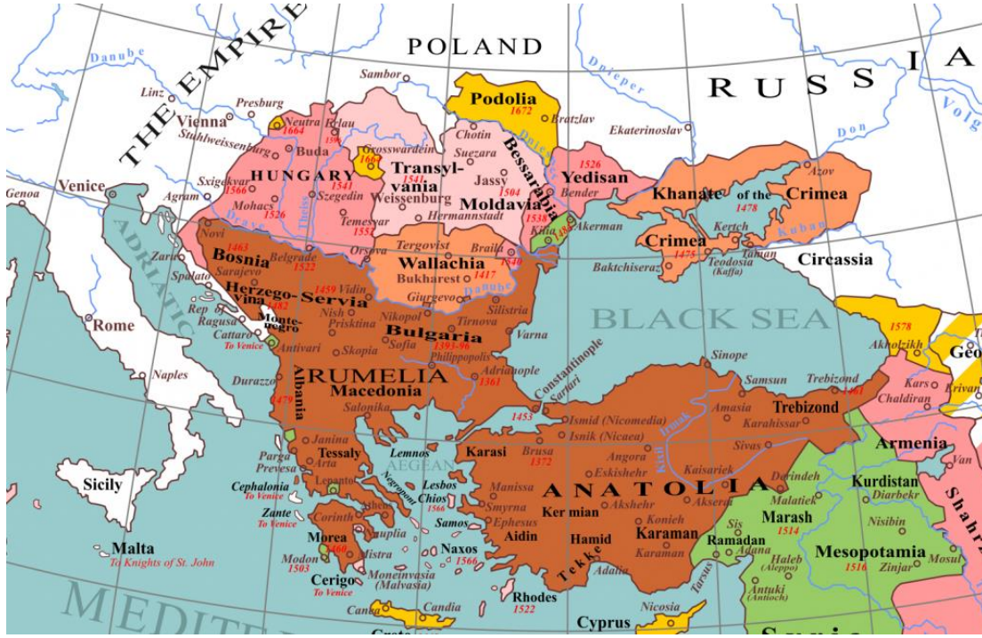
Osmanlıların Avrupa Coğrafyasında Hakimiyet Kurduğu Alanlar