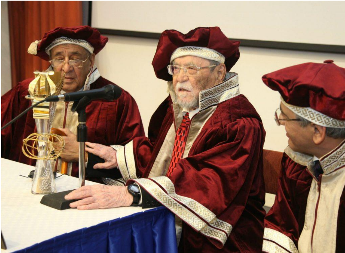
İncalcık ve Avrasya Efsanesi Ödülü

Böylece, İncalcık'ın çalışmalarıyla Türklerin Balkanlarda, “yalnız hükümdarları değil, devlet içinde esas rolü alan sınıfı, yani zâdegâmi kılıçtan geçirdikleri ve bıraktıklarını da zorla İslamiyet'e soktukları” iddiası da çürütülmüştür.