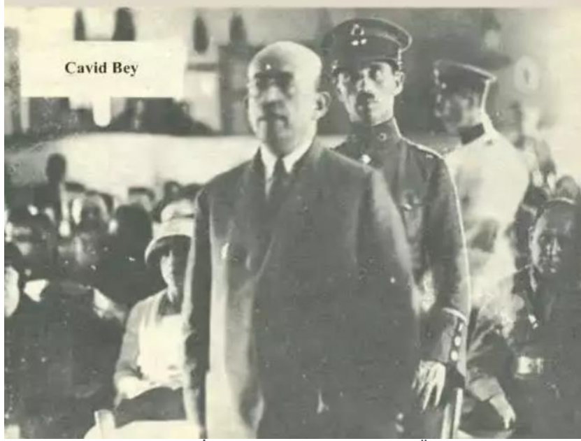
Cavid Bey, İstiklal Mahkemesi Heyeti Önünde