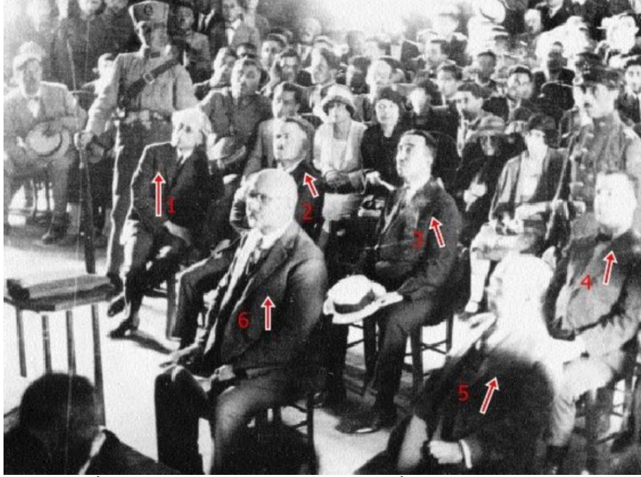
İzmir Suikasti duruşmaları sırasında İstiklal Mahkemesi 1- Refet (Bele) Paşa, 2- Kazım (Karabekir) Paşa, 3- Cafer (Tayyar) Paşa, 4- Ali Fuat (Cebesoy) Paşa, 5- Maliye Nazırı Cavid Bey, 6- Sabit Bey

Tutuklananlar arasında İttihatçıların yanında İstiklal Savaşı'nın meşhur paşaları; Kazım (Karabekir) Paşa, Ali Fuat (Cebesoy) Paşa, Refet (Bele) Paşa, Cafer Tayyar Paşa gibi önemli simalar vardır. Bu isimlerin, 5 Haziran 1925'te kapatılan Terakkiperver Cumhuriyet Fırkası'nın kurucuları ve mensubu olduğunu unutmamak, muhalefetin aslında nasıl bir baskı içine alındığını da göz önünde bulundurmamak gerekir. Bunun yanında eski İttihatçılar ile Birinci Meclis'teki eski İkinci Grup üyeleri de yargılanmıştır. Planın açığa çıkmasının ardından İstiklal Mahkemeleri kurulmuş ve İzmir'in ünlü Elhamra Sineması acele olarak mahkeme salonu haline getirilmiştir.