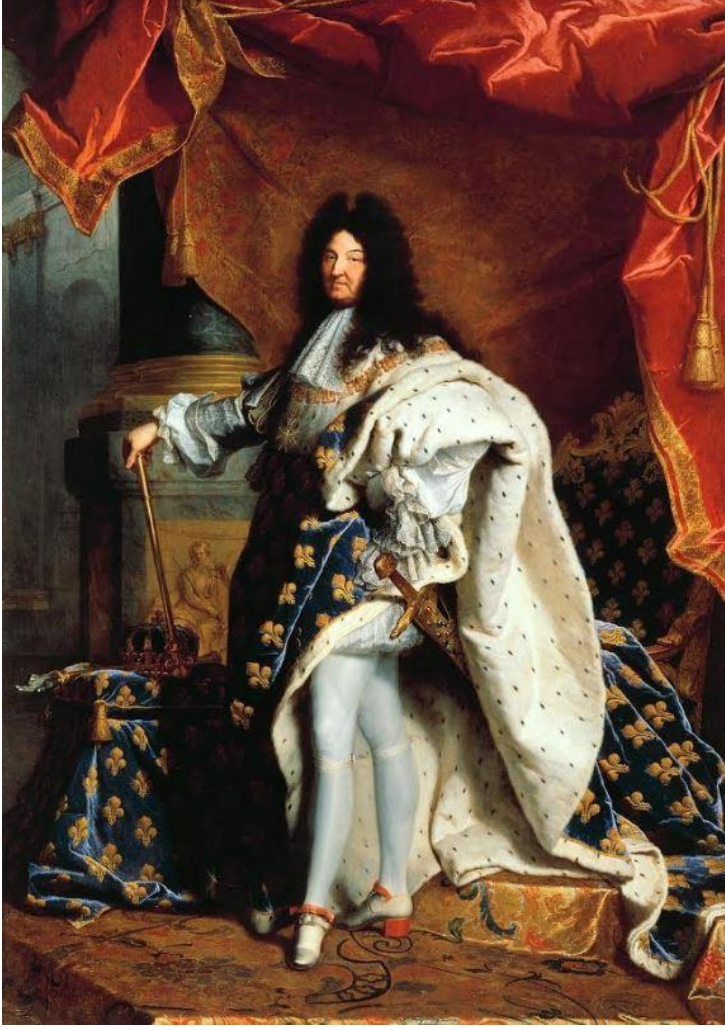
Fransa Kralı XIV. Louis, Namı Diğer Güneş Kral