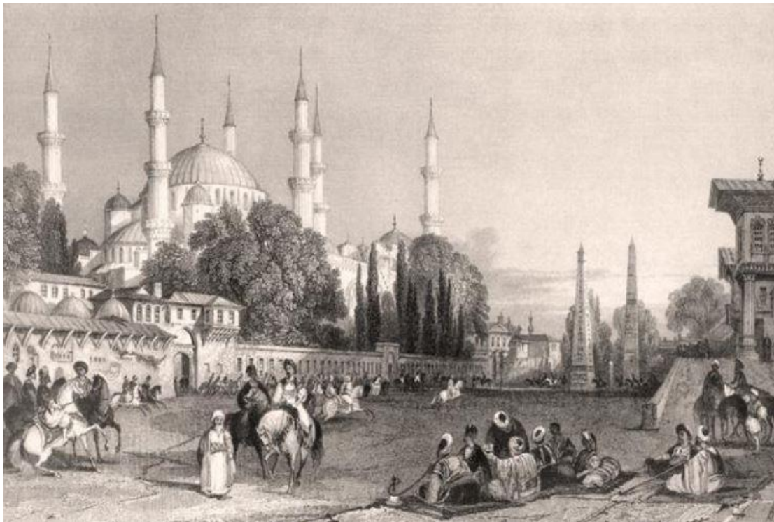
Roma ve Bizans Döneminin Ardından Büyük Oranda Varlığını Koruyup Günümüze Ulaşan Roma Döneminin Hipodromu, Osmanlı Döneminin At Meydanı, Günümüzün ise Sultan Ahmet Meydanı'nın Bir Görünümü

talana ilan etmez ve buranın halkın hukukunu “zimmi” statüsünde muhafaza ederdi.(10) Bu şüphesiz ki şehrin mimari tarzına ve demografik yapısına da yansımış ve sürdürülebilir şehir kavramını besleyici bir nitelik kazanmıştır.(11) Eğer Osmanlı, şehri yağma ve talan ile almaz ise bu şehrin hali hazırda yaşayan halkının fetih öncesi durumunu bir ölçüde korumasına katkı sağlardı. Fakat teslim teklifi kabul görmez ise ordu muzaffer olarak şehre girer, halkın bir bölümünü yağma ve talanın bir parçası olarak köleleştirir ve şehre yeni nüfus iskan ederdi. Bu durum şehrin hem kültürel, hem sosyal, hem dini yapısının değişmesine neden olabilirdi. Bunu biz İstanbul’un fethinde Galata ve İstanbul kıyaslamasını baz alarak açıklayabiliriz. Ceneviz’in Galata kolonisi herhangi bir direniş göstermeden teslim olmuş ve geleneksel şehir yapısını ve nüfusunu koruyabilmiştir. Hatta öyle ki burası sonraki yıllarda bu kozmopolit nüfus yapısının verdiği farklı bir gelişimle Osmanlı Batılılaşmasının önemli bir merkezi olarak sembolik bir hüviyet kazanacaktır.(12) İstanbul ise II. Mehmed’in hassas politikaları neticesinde kozmopolit yapısını çokça kaybetmemekle birlikte yağma ve talana uğrayarak büyük bir yıkım yaşamış ve yeniden imar ile iskan edilmiştir.