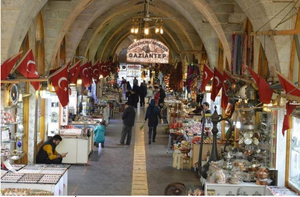
Binlerce Dükkanı İçeren, Şehirlerin Ekonomik ve Sosyal Merkezleri Konumundaki Bedestenlerden Gaziantep Zincirli Bedesteni'nin Günümüzden Bir Görünümü

Mahalleler ise çoğunlukla bir camii veya mescit etrafında kurulan sosyal olarak gayet kapalı, içe dönük ve tutucu birimlerdir.(20) Hatta onların bu kapalı ve birliktelik şeklinde süren yapısı hukuki anlamda da Osmanlı'da karşılık bulmuştur. Bizzat oğlu Süleyman'ın Manisa sancak yöneticiliği sırasında idarenin nasıl yapılacağına dair gönderdiği "siyasetnamede" I. Selim, mahalle içinde işlenen bir cinayetin sonucunda katili bulmanın o mahalledeki insanların sorumluluğunda olduğunu aksi halde mahallenin de cezalandırılacağını bildirmiştir.(21)