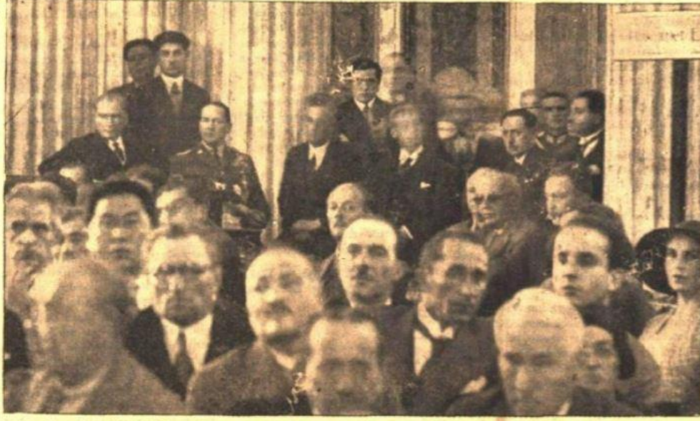
Reisicumhur Hazretleri dün Kurultay müzakeratını takip bayırlarken [yanlarında Amerika Erkanı Harbiye Reisi General Mac Arthur]

Atatürk ve Mac Arthur Dil Kurultayını Dinlerken