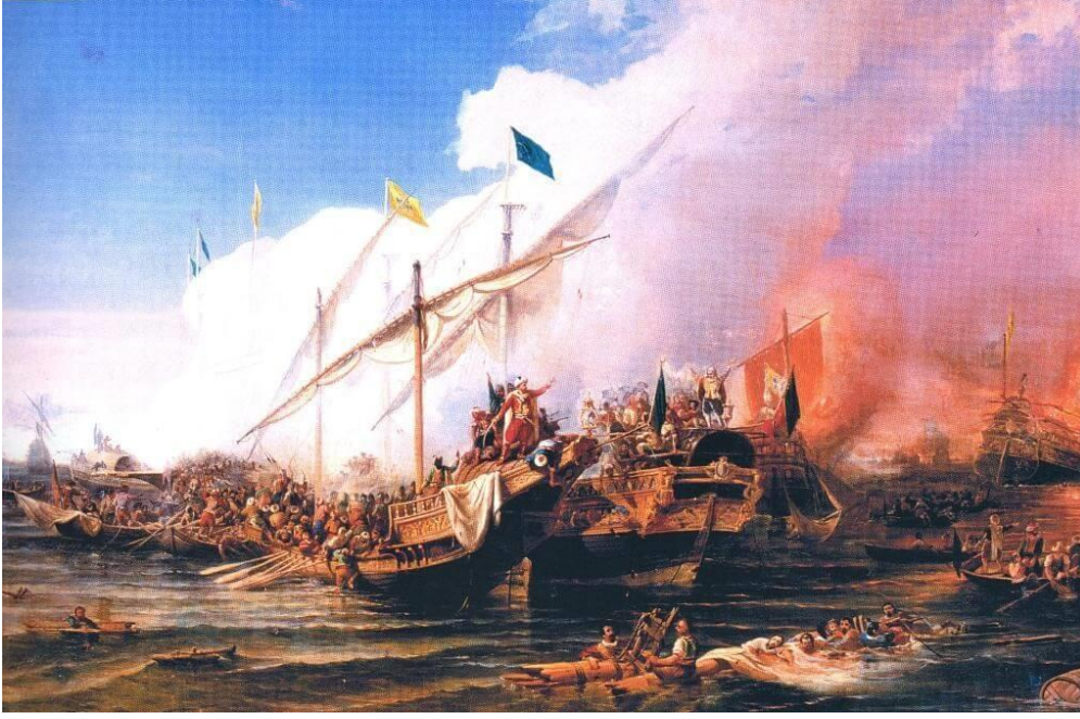
Preveze Deniz Muharebesi'ni Tasvir Eden Osman Nûri Paşa'nın Yağlı Boya Tablosu