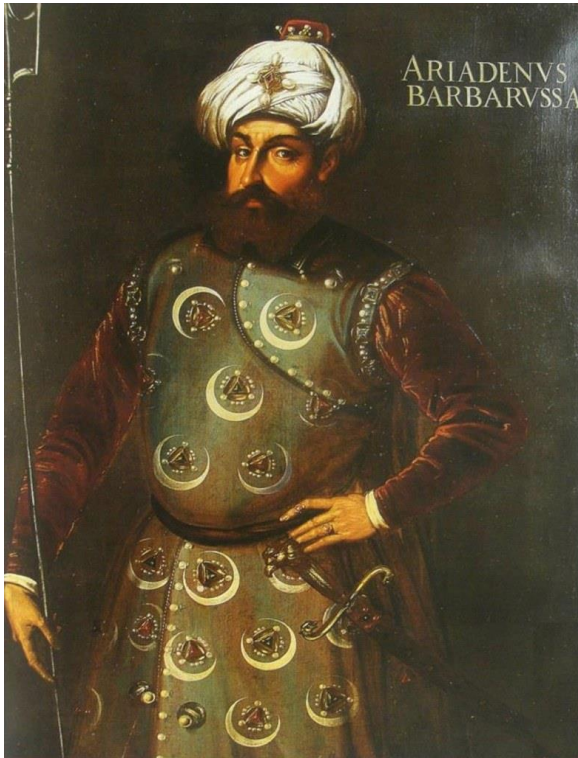
Barbaros Hayreddin Paşa