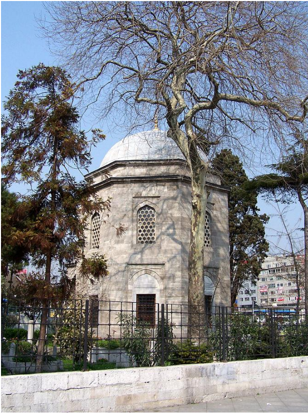
Barbaros Hayreddin Paşa'nın İstanbul'daki Türbesi

oldu. Benim görüşüme göre 1560 yılından itibaren 10 yıl boyunca İnebahtı Deniz Savaşı'na hazırlanan İspanyolların Osmanlı denizcilik teşkilatını inceledikleri, özellikle Cezayir-i Bahri Sefid Eyaleti modelini örnek alarak uygulamaya çalıştığı anlaşılmaktadır. İspanyol raporlarına göre Osmanlı denizgücünün başarısının sırrı donanma komutanlığı görevini bir eyaletin yönetimi ile birleştirmektir. Zira bu teşkilat biçimi Osmanlı tarafına kaynakların verimli kullanılması ve donanmanın ihtiyaç duyduğu asker ve malzemenin temini açısından müthiş bir avantaj sağlıyordu. Ayrıca daha önce belirttiğim gibi İnebahtı'ya hazırlanan İspanyol komutanlarının Preveze'yi ve Barbaros'un savaş taktiklerini tekrar tekrar inceledikleri ve çalıştıkları anlaşılıyor. Buna karşılık Osmanlı tarafında Uluç Ali Paşa İnebahtı'dan önceki saatlerde toplanan savaş konseyinde Barbaros ve Turgudca gibi deniz kurtlarının tecrübeleri unutulduğu için neredeyse isyan halindedir. Eğer İnebahtı'da Osmanlılar Barbaros'un Preveze'de uyguladığı taktiği uygulasalar ve daha temkinli hareket etselerdi sonuç büyük ihtimalle oldukça farklı olurdu.