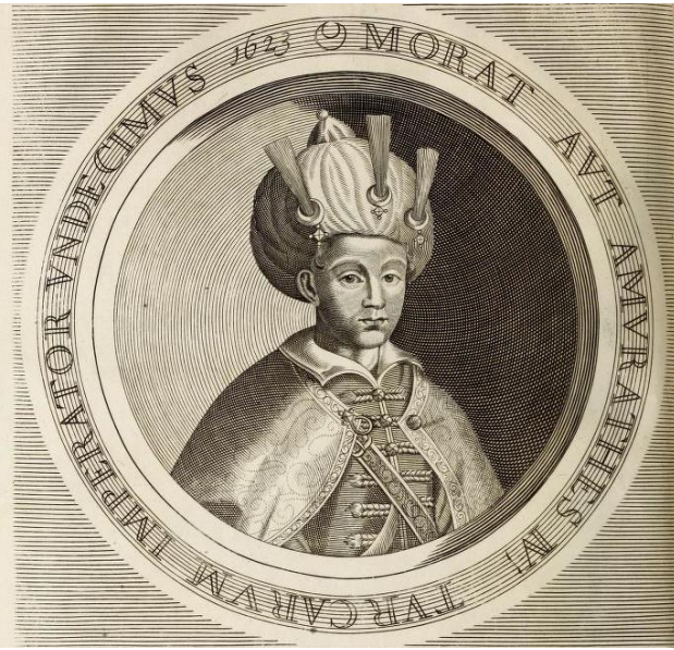
IV. Murad'ın Çocukluğunu Tasvir Eden Bir Resim

Şehzade Murad, babasının sağlığındaki ilk beş yılı, amcası I. Mustafa'nın ilk ve ikinci birer yıllık saltanatı [ilk saltanatı; 22 Kasım 1617-26 Şubat 1618, İkincisi; 20 Mayıs 1622-10 Eylül 1623] ile sonrasında abisi II. Osman'ın dört yıllık saltanatında huzurlu günler geçirdi. Sarayda, sonraki yıllarda doğan kardeşleri ile birlikte annesi Kösem Sultan'ın koruması altında idi. Kösem, her bir şehzade ve kızlarının eğitimi ile yakından ilgileniyor, şehzadelerini birer sultan adayı olarak yetiştiriyordu. Ancak bu mesut günler Sultan Osman Vak'ası olarak kaynaklara geçen ve II. Osman'ın tahttan indirilip sonrasında katli ile biten süreçte yerini endişe ve ölüm korkusuna bıraktı. Zira II. Osman Vak'ası'nda şehzadeler Üsküdar'a nakledilmek için dışarı çıkartıldıklarında, Kapı ağalarından birisi şehzadelere öldürmek kastı ile saldırmış, bu durumu fark eden Hattat Hasan Ağa, son anda yetişerek Şehzade Murad ve kardeşlerini ölümden kurtarmıştı. Şehzade Murad, II. Osman'ın tahttan indirilip I. Mustafa'nın ikinci defa cülus ettirildiği süreçte tam olarak ne olup bittiğini anlayamamış olsa da, bu sırada yaşadığı endişe ve ölüm korkusunun, çocuk ruhunda silinmez derin izler bıraktığını söylemek mümkündür.