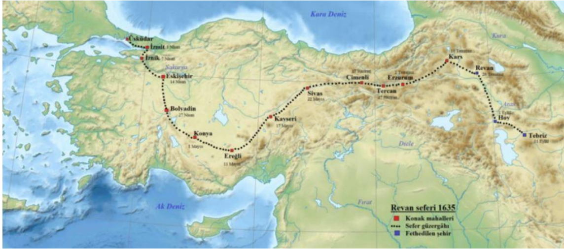
Revan Seferi Güzergahı

söyler. Bunun üzerine IV. Murad “ Ya kuvvetim kalmamış mıdır, gör imdi ” der ve Evliya’nın kemerinden tuttuğu gibi onu havaya kaldırır. Dakikalarca Evliya Çelebi’yi havada tutan IV. Murad, son bir defa onu gürz gibi etrafta çevirdikten sonra yere bırakır. Padişah sağlığı el verdikçe cirit oynar, güreş yapar ve sürekle avlarına giderdi. Ancak sağlığı çok nadir olarak düzenli idi. Özellikle Revan ve Bağdat Seferleri sırasında ayaklarından ağır surette ızdırap çekmişti.