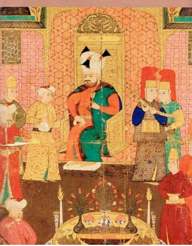
IV. Murad'ın Meclisini Resmeden Bir Minyatür