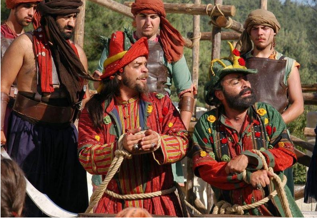
Filminden Bir Kare

yandan filmin senaryosunun oluşturulması aşamasında ciddi bir tarihi okuma yapıldığı anlaşılıyor. Bu tarihi okumanın ikincil kaynaktan çok birincil kaynak okuması olduğunu da anlayabiliyoruz. Özellikle Aşıkpaşazade ve İbn Batuta gibi kaynakların verdiği ilham altında bir dönemsal panorama ile karşı karşıya kalıyoruz. Aşıkpaşazade'nin kroniğinde geçen Bacıyan-ı Rum taifesinin yine bu filmde kurgusal olarak hayat bulduğuna şahit oluyoruz. Bacılar üzerinden kadınların toplumsal rolüne de atıfta bulunan film, şüphesiz bu noktada da 600 yıl önce geçmesine rağmen oldukça güncel mesajlar verebiliyor.