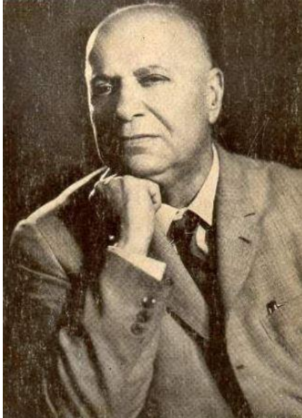
Şevket Süreyya Aydemir

Şevket Süreyya Aydemir, İkinci Adam'ın ilk cildinde, İsmet İnönü'nün 1884 tarihinde doğumundan, Başvekilliği bırakması ve Atatürk'ün vefat ettiği 1938 tarihe kadarki dönemin akışını verir. İsmet İnönü'nün, 1884-1938 devri, Osmanlı Devleti'nin son dönem hadiseleri ve Erken Cumhuriyet'in ortaya çıkışı bakımından oldukça önemlidir. İnönü'nün askerlik hayatının tamamını alan bu dönemde; tahsil hayatı, İttihat ve Terakki Cemiyeti'ne katılması, Birinci Cihan Harbi, Milli Mücadele ve ardından Erken Cumhuriyet'in kadrolarının oluşması, dönemin öne çıkan dinamik hadiseleridir. İnönü'nün kronolojik bir şekilde ilerleyen askeri ve siyasi hayatının yanında, Osmanlı Devleti'nin son dönemine ve Erken Cumhuriyet'in ilk yıllarına damga vurmuş, tarihi isimleri de bu biyografi çevresinde görmek mümkündür. Bunun yanında özellikle 1930'lı yıllarda İsmet İnönü ve Atatürk arasındaki ilişkileri de bir bakıma gözlemleyebilmemiz, yine eserin ilk cildini mühim bir yere konumlandırmaktadır.