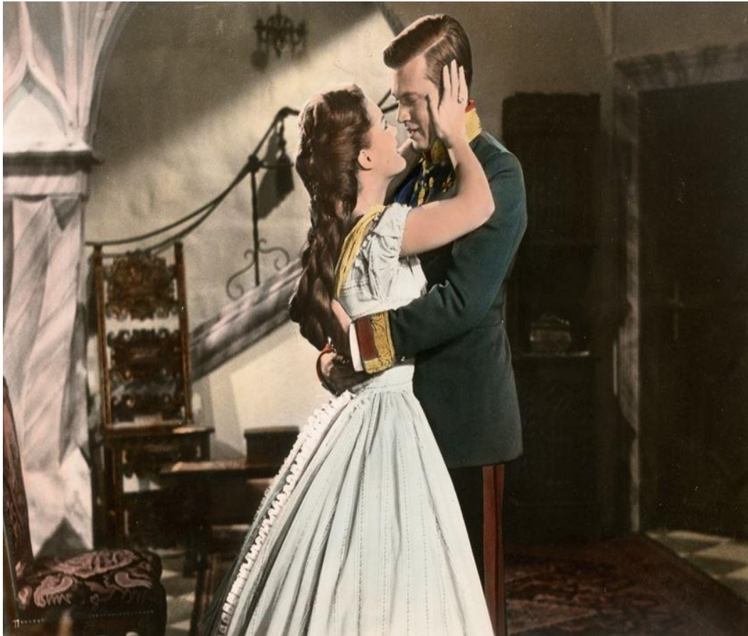
Sissi ve İmparator Franz Joseph (I.)

Sissi, Bavyera'da tahtta hak iddia edemeyen bir ailenin kızı olarak dünyaya geldi. Ailesi kendi devrinin yargılarına göre liberal sayılırdı. Elisabeth'e göre protestanize edilmiş bir çevrede büyüdü. 16 yaşına geldiğinde annesi Ludovika tarafından Savoy Krallığı'nda kendisine münasip bir damat adayı arandı ancak bulunamadı. Bu yıllarda Viyana'da da Sophie oğlu Franz Joseph'in (Franz Joseph I. olarak tahta çıkmıştı) en doğru ve kârlı evliliği yapması için gözlerini Prusya başta olmak üzere Alman krallıklarına çevirmişti. Franz Joseph gelin adaylarından hiçbirini beğenmiyordu. Nihayet Sophie kız kardeşi Ludovika'ya danıştı. Bavyera Krallığı ile olan bağların güçlendirilmesi adına Ludovika'nın büyük kızı Helene, Franz Joseph ile evlendirilebilirdi. Bu karardan sonra Ludovika ve Helene Avusturya'yı ziyaret etmek için yola çıktı. Böylece Franz Joseph kendine uygun görülen gelin adayı ile tanışabilecekti. Ludovika yanında küçük kızı Elisabeth'i de götürdü. Bu anda sanki tarih sürücüsü atına binmiş onu dörtnala koşturuyordu. Franz Joseph işte ilk kez o gece gördü Elisabeth'i ve ilk görüşte âşık oldu. İmparator, gelini olarak Helene'yi değil Elisabeth'i seçmişti.