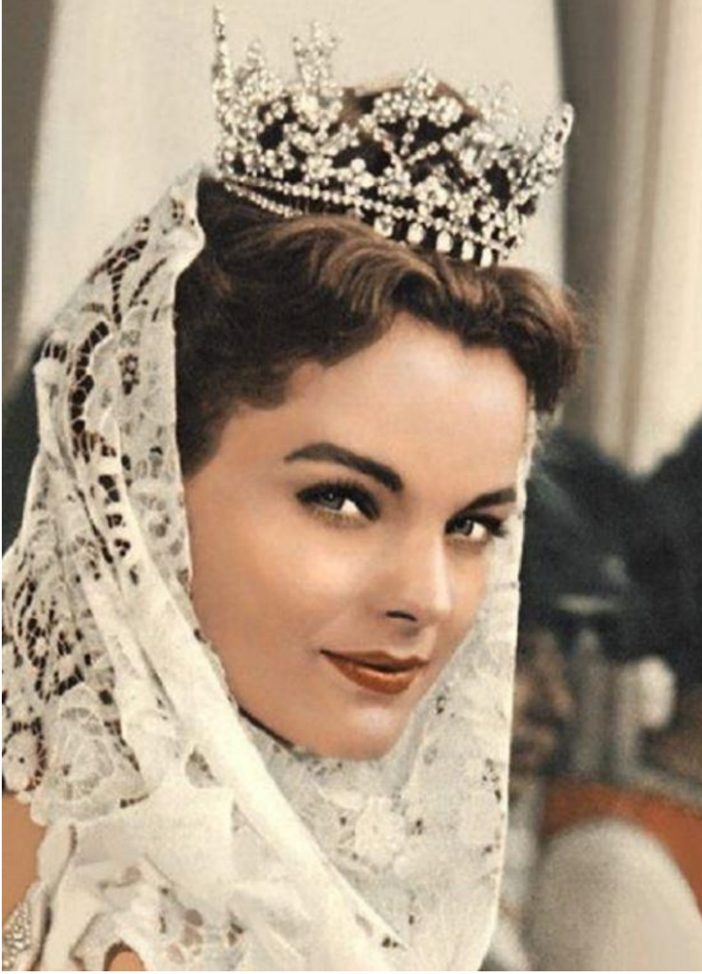
Sissi, İmparatoriçe Elisabeth

Genç ve birbirine aşık çift tanışmalarından bir yıl sonra evlendi. Elisabeth'i Avusturya Habsburg tacını temsile layık görmeyen Sophie, her fırsatta bu fikrini açıkça gösterdi. Çiftin ilk çocukları doğduğunda adı Sophie konuldu. Çocuk annesinden çok büyükannesi ile vakit geçirmek zorundaydı. Ateşli bir hastalığa yakalanıp küçük yaşta hayatını kaybedene dek annesini çok az görebilen çocuk Elisabeth ve Sophie arasındaki ilişkinin de tamamen kopmasına sebep oldu. Sissi'nin bundan sonraki hayatını bu hazin olayın fazlasıyla etkilediği açıktır. Çiftin pek tabii başka çocukları da oldu. Ne var ki hiçbir şey büyük bir aşk ile başlayan bu evliliği kurtarmaya yetmedi.