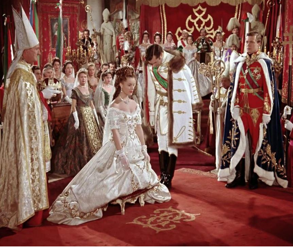
Sissi ve Gyula Andr ssy

Sissi'nin tuhaf ve aęın normlarına uymayan hayatı sona yaklařırken trajik ve yıkıcı etkilere sahip hazin bir olay vuku buldu. Franz Joseph ve Elisabeth'in tek oęlu olan tahtın varisi Rudolf gelecek vaat eden bir veliahttı. İmparatorluk iinde yařayan milletlerin k lt r ne, geleneklerine, dillerine meraklıydı. İmparatorluk  zerine yapılan alıřmaların en hevesli hamisiydi. Babasından sonra tahta gemesi beklenen veliaht prens metresi ile intihar etmiřti. Bu  z c  olaydan kısa bir s re sonra Elisabeth de İsvire'de bir İtalyan anarřist tarafından vurularak  ld r ld . Neyse ki bu hadise o zaman m ttefik olan Avusturya ile İtalya arasında bir savař ıkmasına sebep olmadı. D nya bir savař iin o yıllarda hen z doęmamıř olan Princip'in ekeceęi tetikten ıkan kurřunun bir bařka Habsburg'a saplanmasını, yaklařık eyrek asır beklemek zorundaydı.