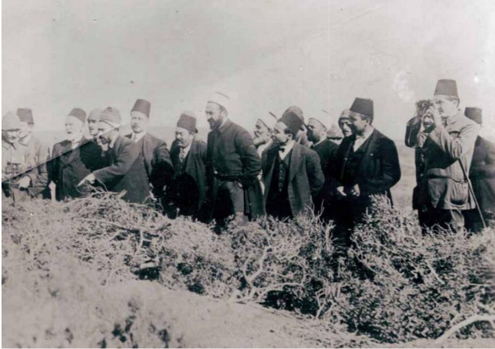
Anafartalar Grup Komutanı Albay Mustafa Kemal, İstanbul'dan Gelen Üyelerine Cepheyi Gösteriyor