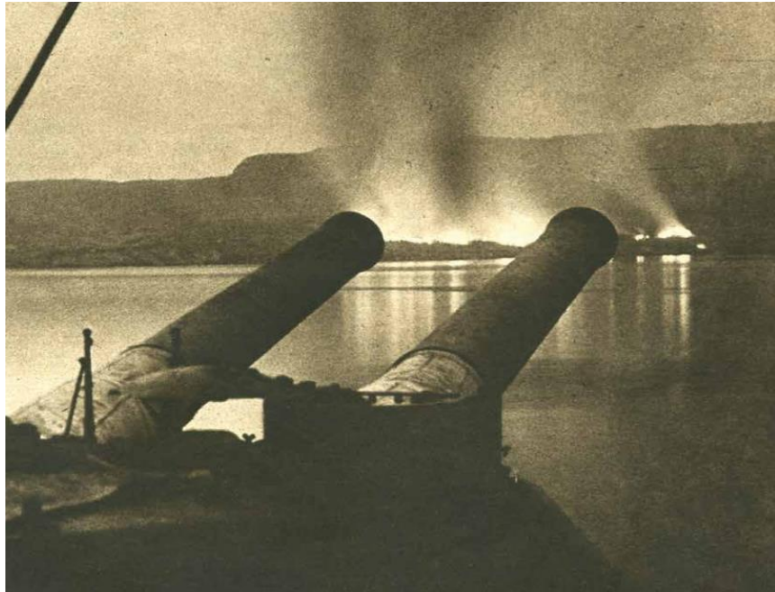
İtilaf Devletleri, Yarımada'yı Terk Ederken Kıyıda Bıraktığı Malzemeleri İmha Ediyor

Doğrudur. 1915 İstanbul'u bugünkünden çok daha kozmopolit bir şehirdi. Şehrin yarısının gayrimüslim olduğunu düşünürseniz tavırlarını tahmin etmek güç değil. Azınlıkların önemli bir kısmı İtilaf devletleri zaferine kendilerini hazırlamışlardı. Türk tarafının sevinci Balkan Savaşı'nın acı hatıraları daha bitmemişken müthiş bir moral kazandırdı. Nisan ayında KütulAmare zaferi haberi bu sevinci katladı