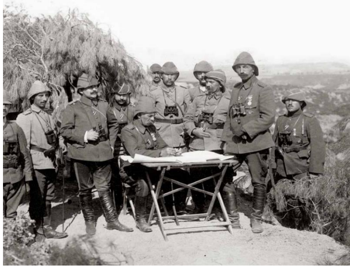
3. Kolordu Komutanı Esat Paşa, Cephedeki Mekanında Karargah Subaylarıyla Birlikte

Çanakkale Savaşı uzun süre ağırlıklı olarak kahramanlık menkıbeleriyle ya da sadece Mustafa Kemal Atatürk'ün savaşta oynadığı rol üzerinden anlaşılmaya çalışıldı. Oysa 1.Dünya Savaşı'nın kaderini değiştiren Çanakkale'ye daha geniş perspektiften bakmaya ihtiyaç var. Ne mutlu ki ülkemizde askeri tarih alanında önemli çalışmalar giderek artıyor. Bunun yansımalarını da görüyoruz. Savaşın askeri, uluslararası siyaset ve kültürel yönlerini ele alan nitelikli eserler çıkacağına inanıyorum. Özellikle Batı cephesi ve 1. Dünya Savaşı içerisindeki rolü ile ilgili daha çok çalışma yapılmalı. Öğreneceğimiz çok şey var.